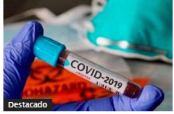
Colombia reportó su primer día...