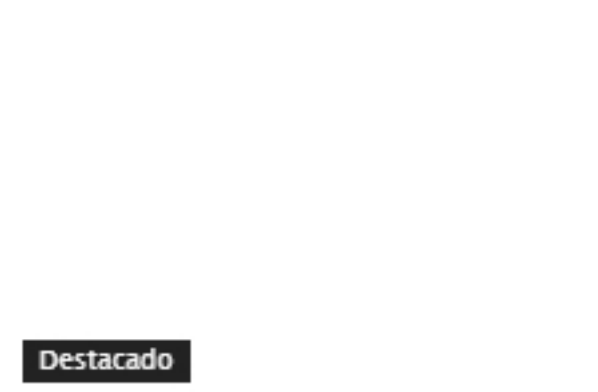
Para colombianos co...