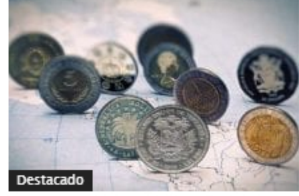
Compartimiento mixto de...