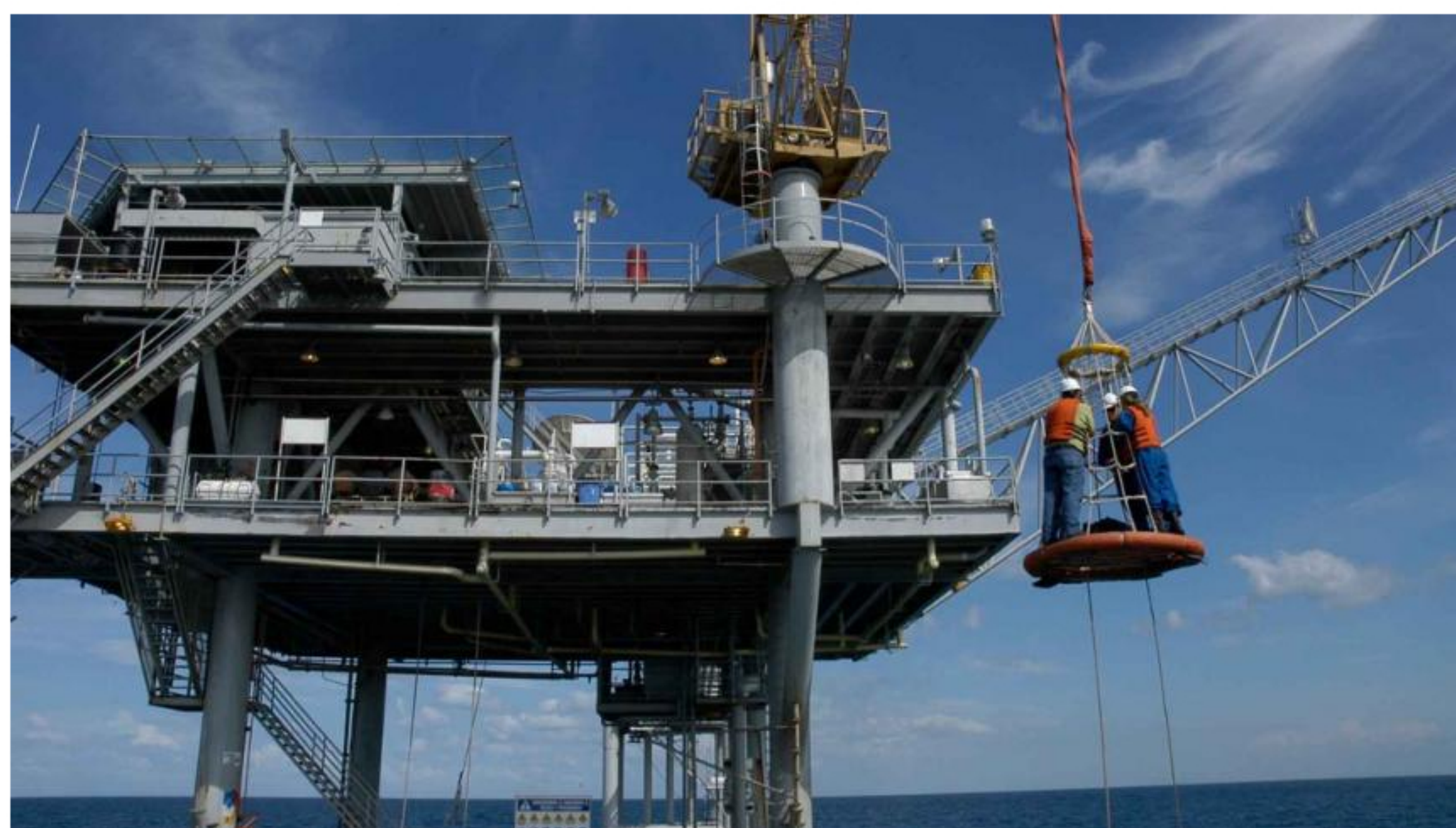
Operarios de Hocol durante labores.