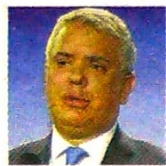
IVÁN DUQUE PRESIDENTE DE LA REPÚBLICA

El presidente Iván Duque decretó Estado de emergencia económica y social a nivel nacional y, además de un paquete de medidas económicas que contemplan, entre otras, la devolución del IVA desde abril y el aislamiento para los mayores de 70 de años.