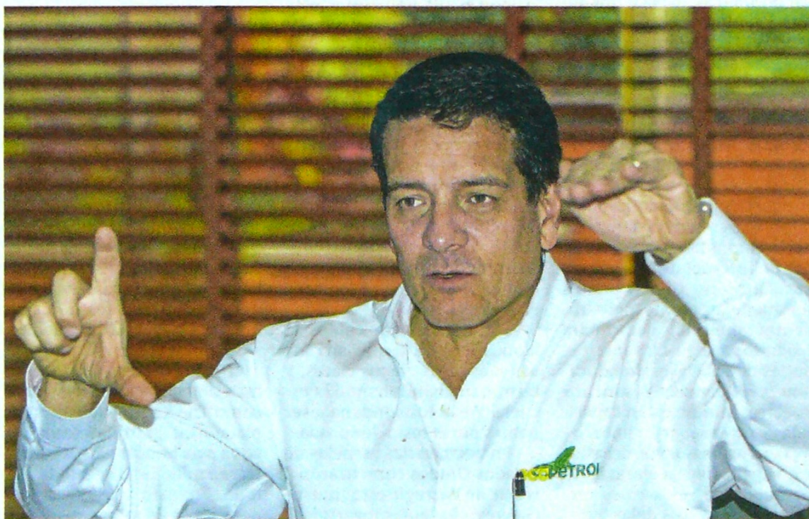
Felipe Bayón, presidente de Ecopetrol, dijo que las medidas tomadas por la empresa van en línea con la necesidad de garantizar su sostenibilidad ante la coyuntura.

Esto convierte el 2020 en un año retador para Ecopetrol, pues no solo es el efecto del