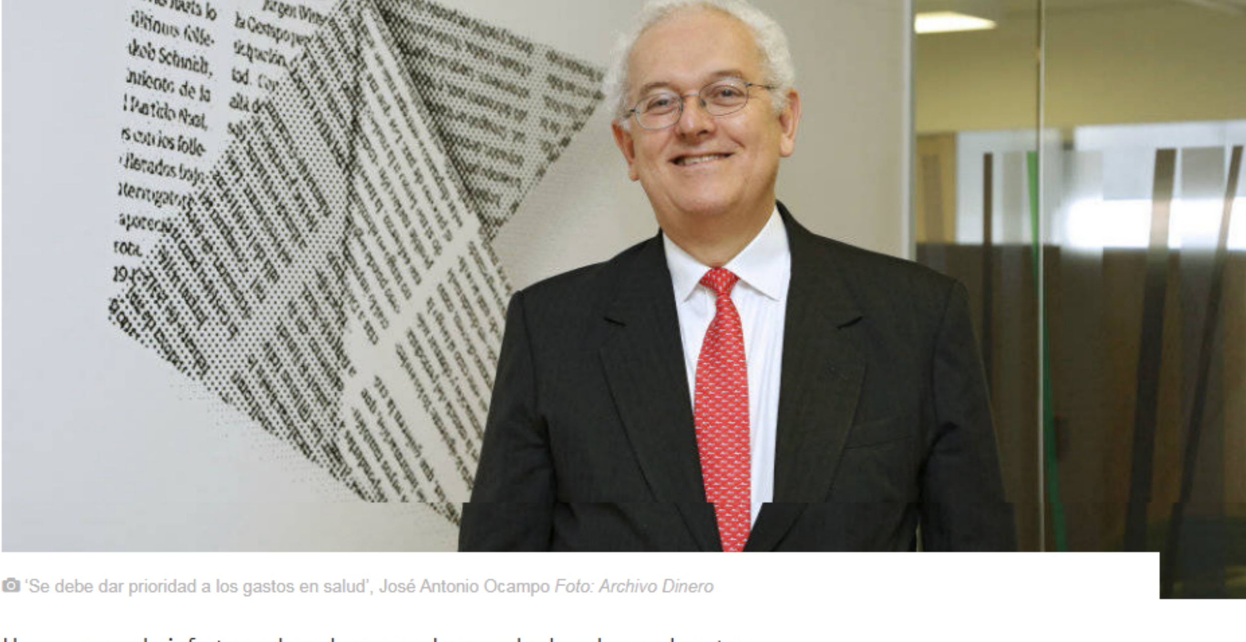
© 'Se debe dar prioridad a los gastos en salud', José Antonio Ocampo Foto: Archivo Dinero

En diálogo como Semana y Dinero el exministro de Hacienda habló del impacto en la economía colombiana de la declaración de pandemia por el coronavirus y la pelea de Arabia Saudita y Rusia por la oferta de crudo.