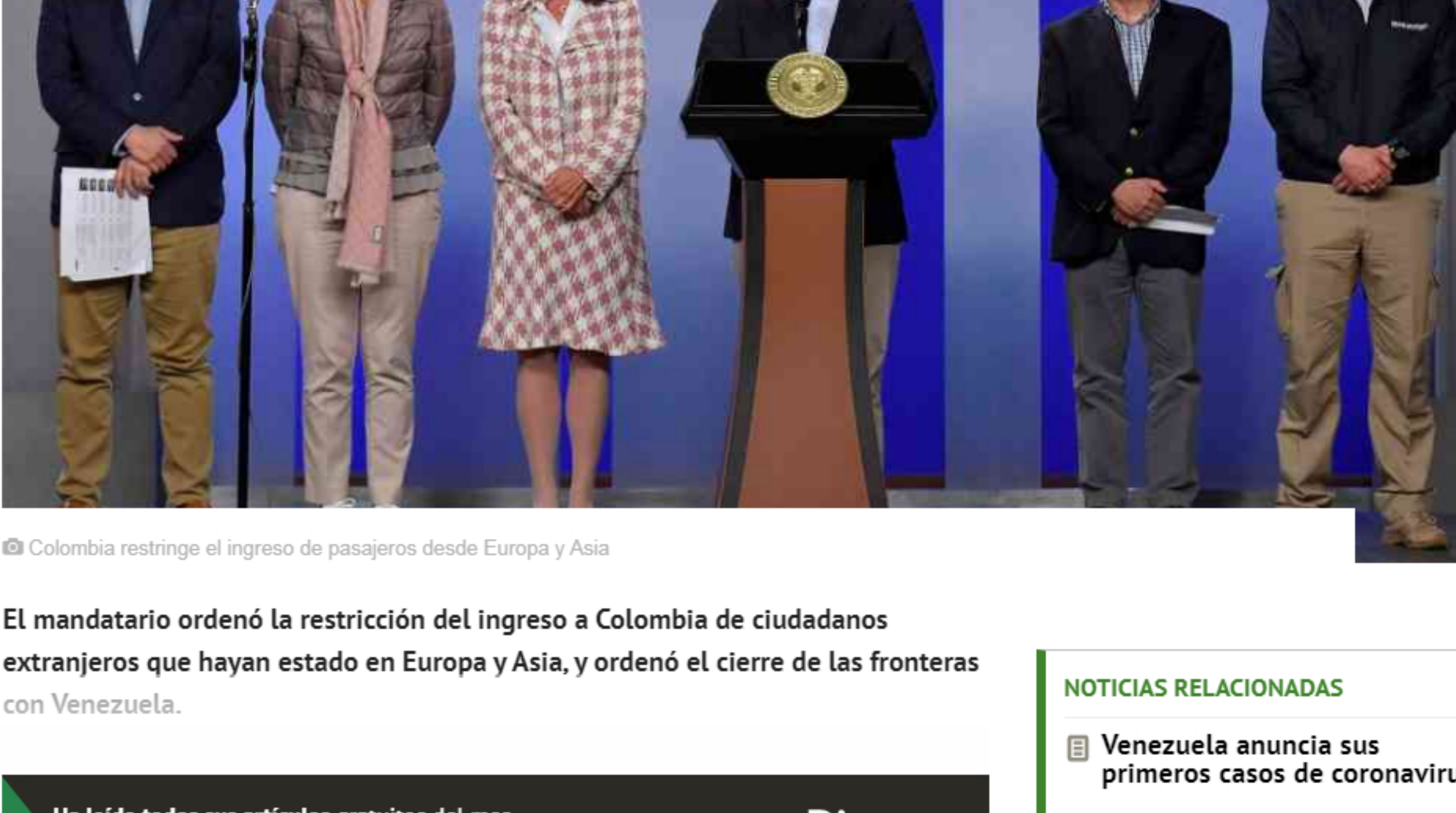
© Colombia restringe el ingreso de pasajeros desde Europa y Asia

Este viernes el presidente Iván Duque anunció nuevas medidas para prevenir la propagación del coronavirus en Colombia. Desde las 5:00 a.m. de hoy está cerrada la frontera con Venezuela.