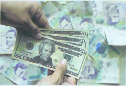
En lo que va del 2020 el peso colombiano se ha devaluado un 9,38% frente al billete verde.

La bolsa de Colombia cerró con desplome del 10,53% y la divisa estadounidense en máximos. Preocupación.