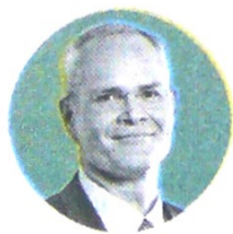
DARREN WOODS Director ejecutivo de Exxon.

Las compañías de energía deben enfocarse en los esfuerzos globales y sistémicos para reducir los gases de efecto invernadero, en lugar de simplemente reemplazar sus propios activos pesados en emisiones por otros más limpios para verse bien, dijo el director ejecutivo, Darren Woods, en N. Y. "Las compañías individuales que establecen objetivos y luego venden activos a otra compañía para que su cartera