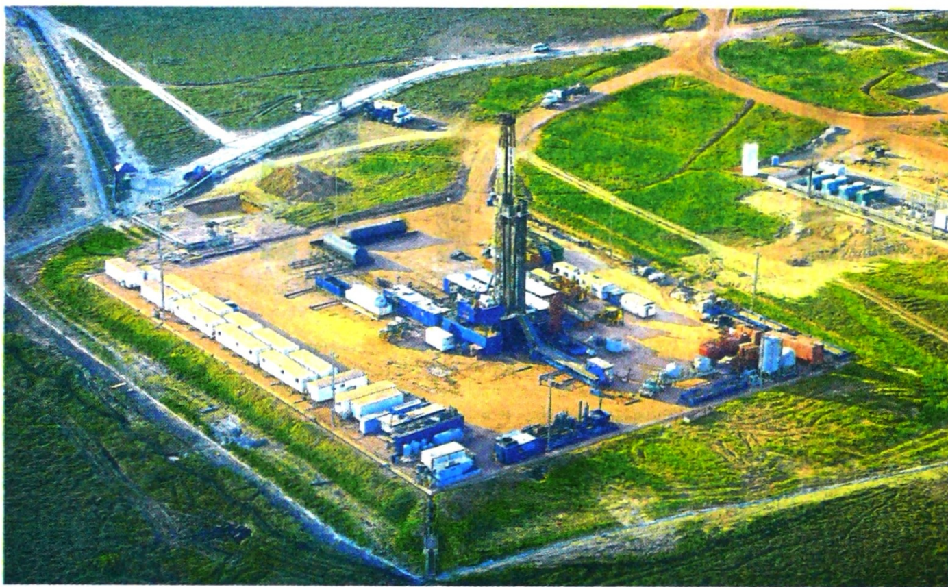
En el municipio de Santa Rosalía (Vichada) opera el contrato Las Garzas de la compañía New Granada Energy Corporation.

departamentos de Meta y Vichada, se encuentran en exploración los campos CPO14 y CPO 8 los cuales son operados por Ecopetrol y por Talismán , respectivamente.