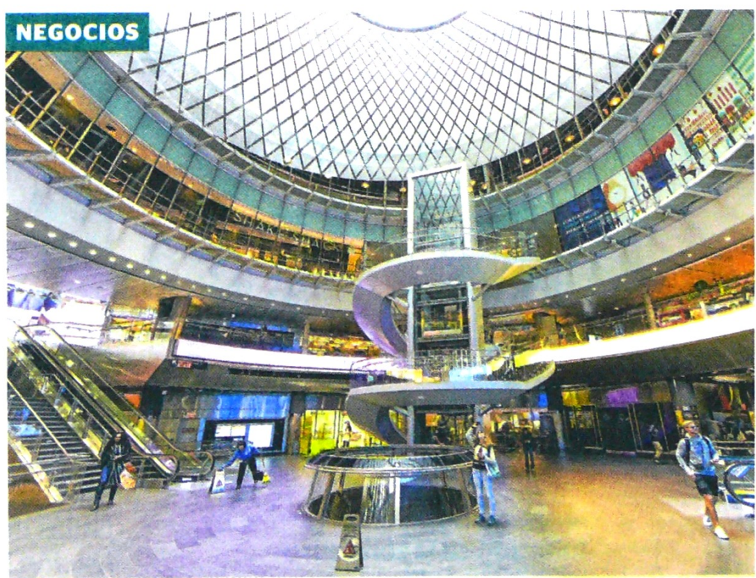
Camacol Bogotá y Cundinamarca, en alianza con Retailligence, realizaron el estudio de percepción.