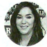
María Fernanda Suárez Ministra de Minas y Energía