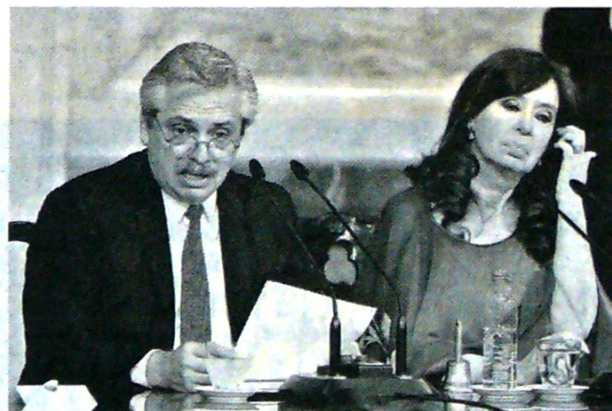
El gobierno de Alberto Fernández habla con bonistas.

(EFE) Las asambleas de Primavera del Fondo Monetario Internacional y del Banco Mundial se celebrarán este año por videoconferencia por temor al coronavirus. La cita prevista para el 17 y 19 de marzo reúne unos 10.000 participantes entre funcionarios de los 189 países miembros.