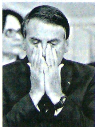
El presidente de Brasil, Jair Bolsonaro.

El Congreso aprobó en octubre una polémica reforma de las jubilaciones y el