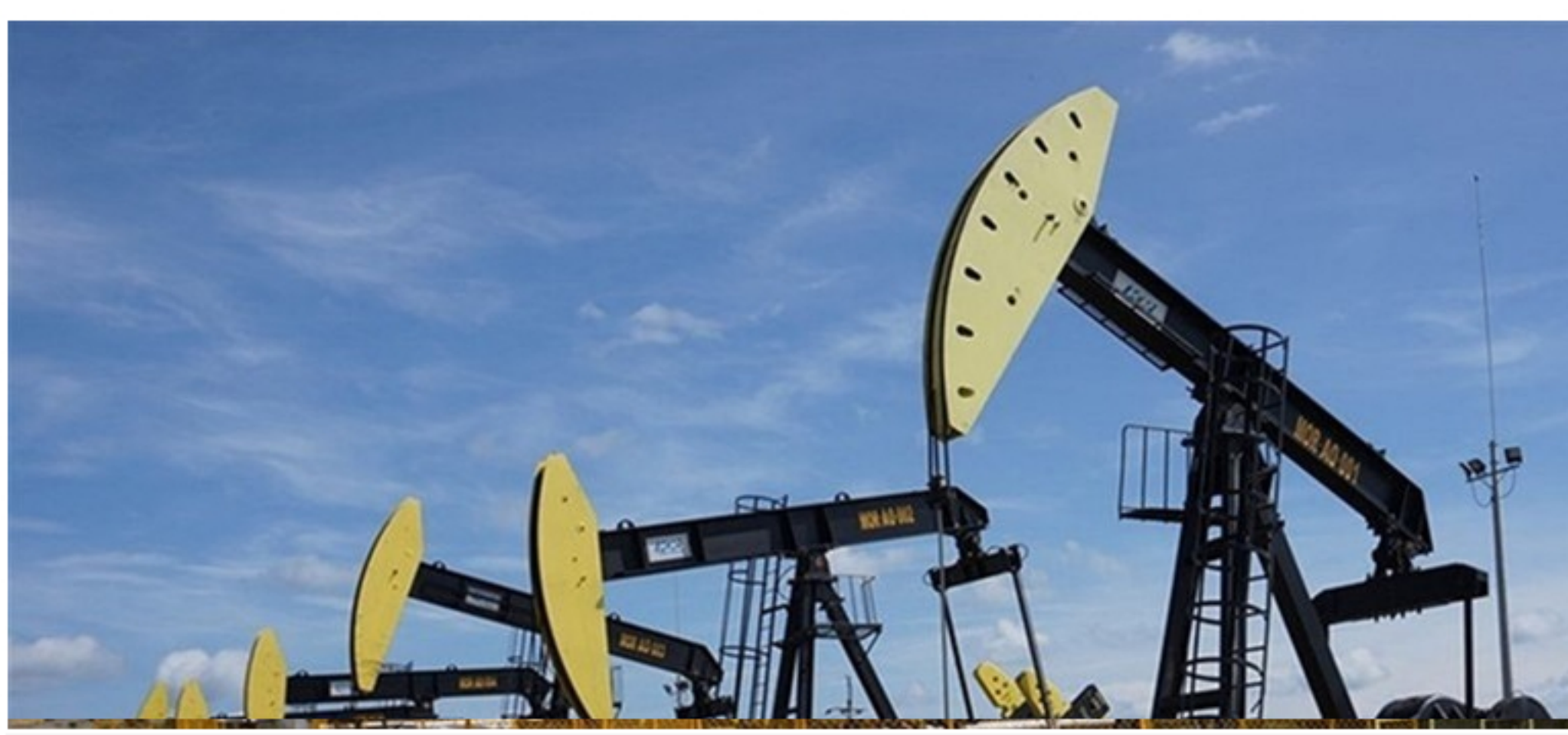
Según la ACP, en 2022 se empezaría explotación de hidrocarburos a través del fracking.

La Asociación Colombiana del Petróleo aseguró que varias empresas del sector tienen 650 millones de dólares para invertir en el proyecto de los pilotos de fracking.