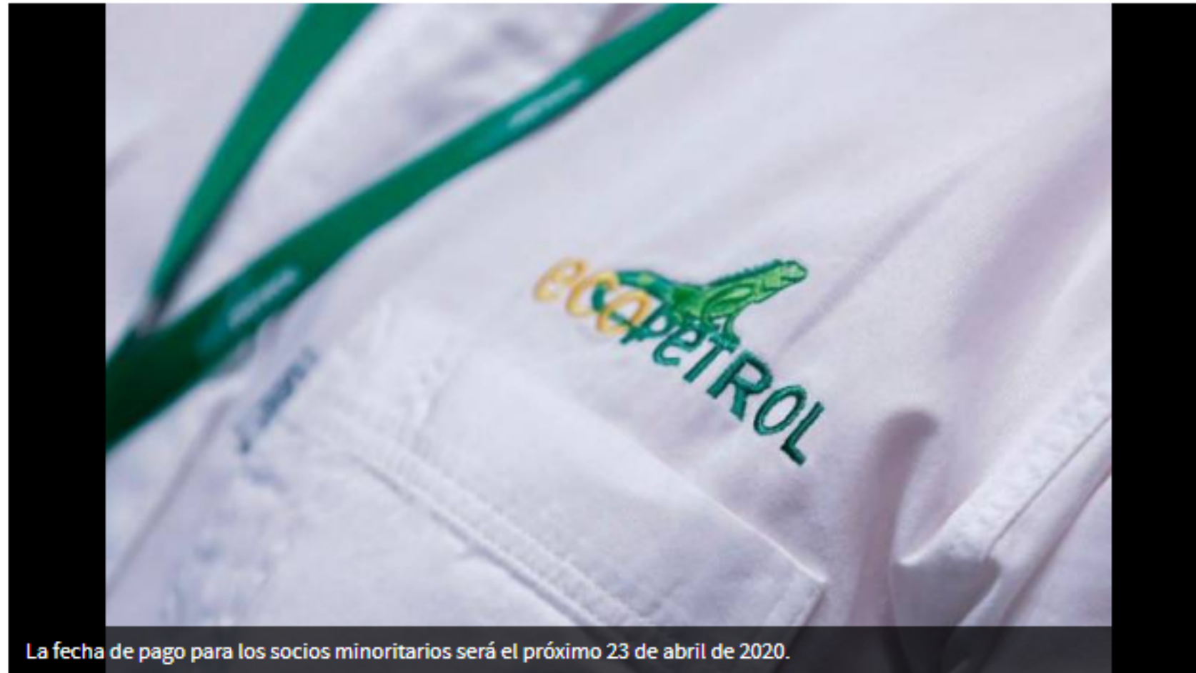
La fecha de pago para los socios minoritarios será el próximo 23 de abril de 2020.

COLPRENSA | @ElUniversalCtg | 02 de marzo de 2020 11:27 AM |