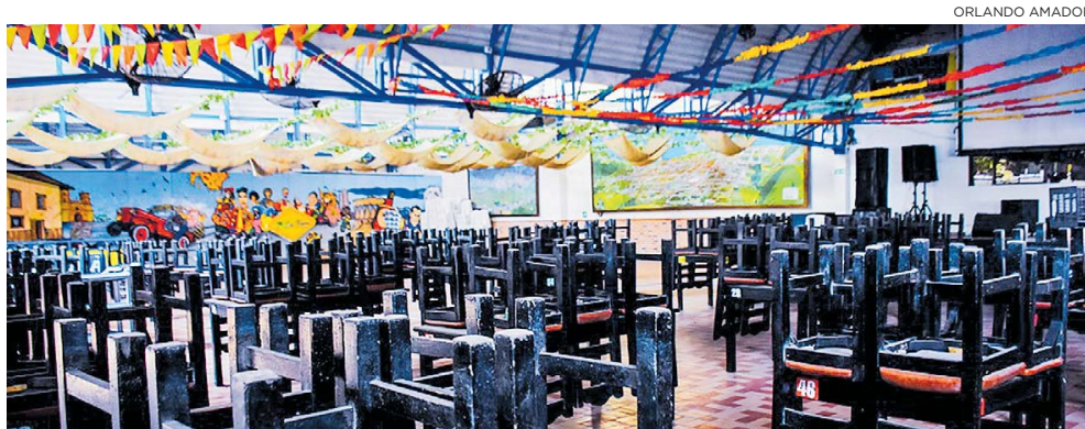
Aspecto de un restaurante que funciona en la ciudad de Barranquilla.