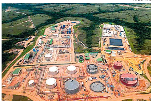
Aspecto de las instalaciones de Campo Rubiales.

Si se compara con la producción registrada en abril de este año (796.164 bpd)