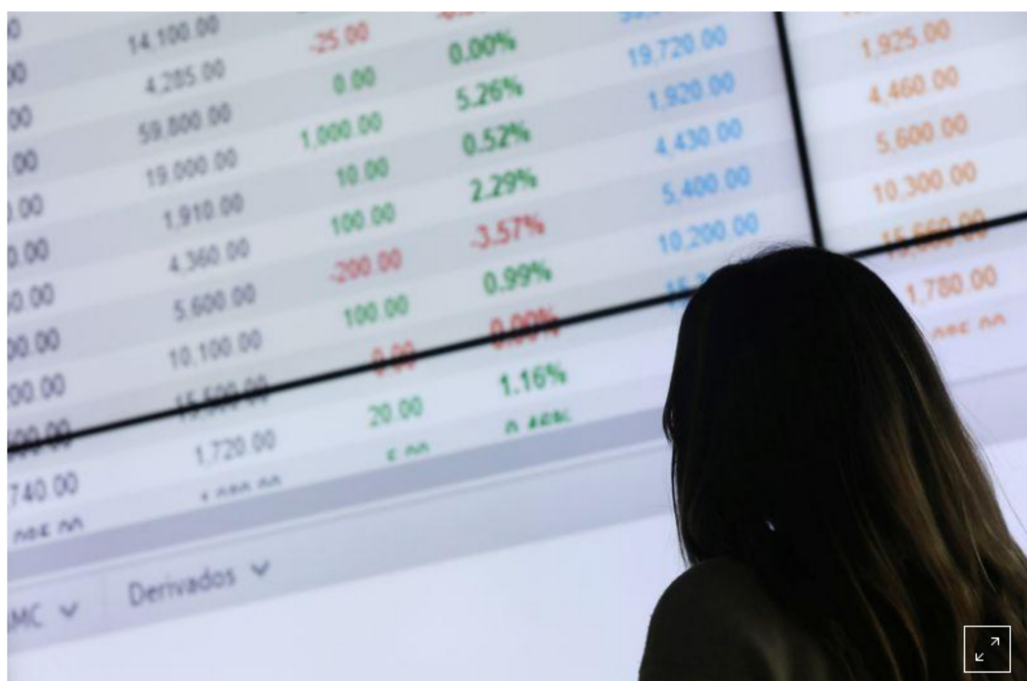
Foto de archivo. Una mujer observa las cotizaciones en una pantalla de la Bolsa de Valores de Colombia, en Bogotá, Colombia, 1 de febrero, 2019. REUTERS/Luisa González

BOGOTÁ, 24 jun (Reuters) - La mayoría de las monedas y bolsas de América Latina cerraron a la baja el miércoles, en medio de la aversión al riesgo después de que el Fondo Monetario Internacional (FMI) estimó que las economías de la región sufrirán una contracción más estruendosa de lo anticipado este año por la pandemia de coronavirus.