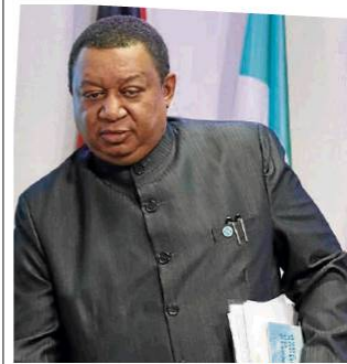
El secretario general de la Opep, Mohammad Barkindo, participará en la reunión del cartel hoy.