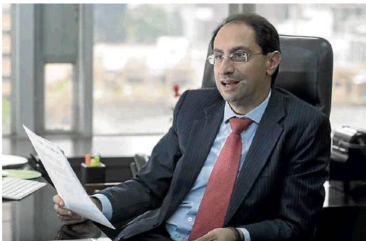
Ministerio de Comercio

Colombia Productiva y Bancoldex pusieron a disposición la línea de crédito Reactive con recursos por $7.600 millones. Se trata de una iniciativa para ayudar a las Mipyme en la implementación de las medidas de bioseguridad y en la reactivación productiva. José Manuel Restrepo , ministro de Comercio, destacó dicha alianza e informó que ya hay 158.567 empresas autorizadas para operar en el país. (KB)