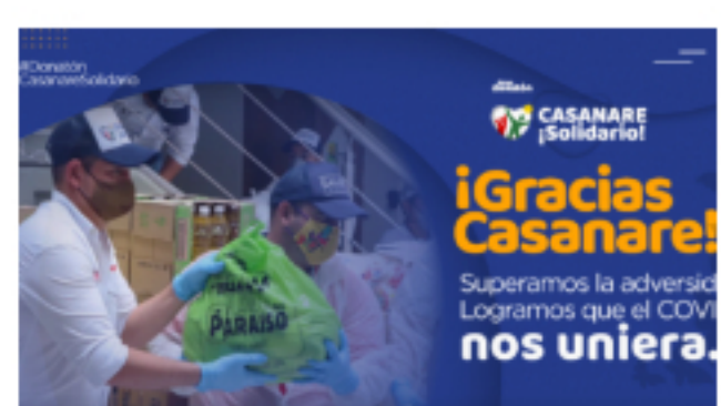
25 abril, 2020 404 Grupo Ecopetrol suma esfuerzos adicionales para fortalecer atención de emergencia por covid-19 en Casanare