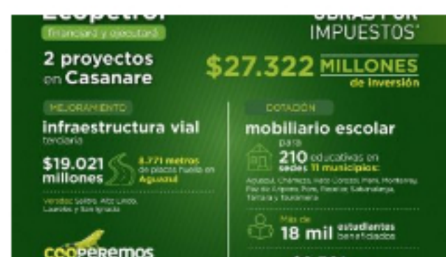
15 mayo, 2020 122 Ecopetrol realizará y ejecutará dos proyectos bajo modalidad de 'Obras por Impuestos' en Casanare