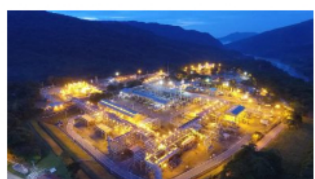
Hace 2 semanas 80 Ecopetrol incrementa actividad de forma escalonada y con protocolo de bioseguridad