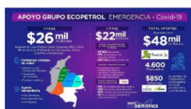
14 abril, 2020 419 Ecopetrol anuncia segundo paquete de ayudas por $22.800 millones