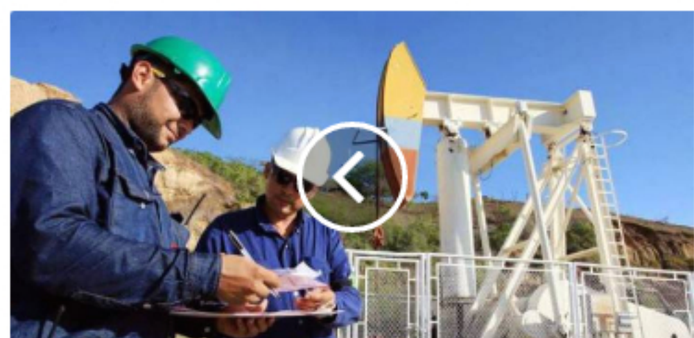
Inescrupulosos están engañando con falsas ofertas laborales para trabajar en Equión