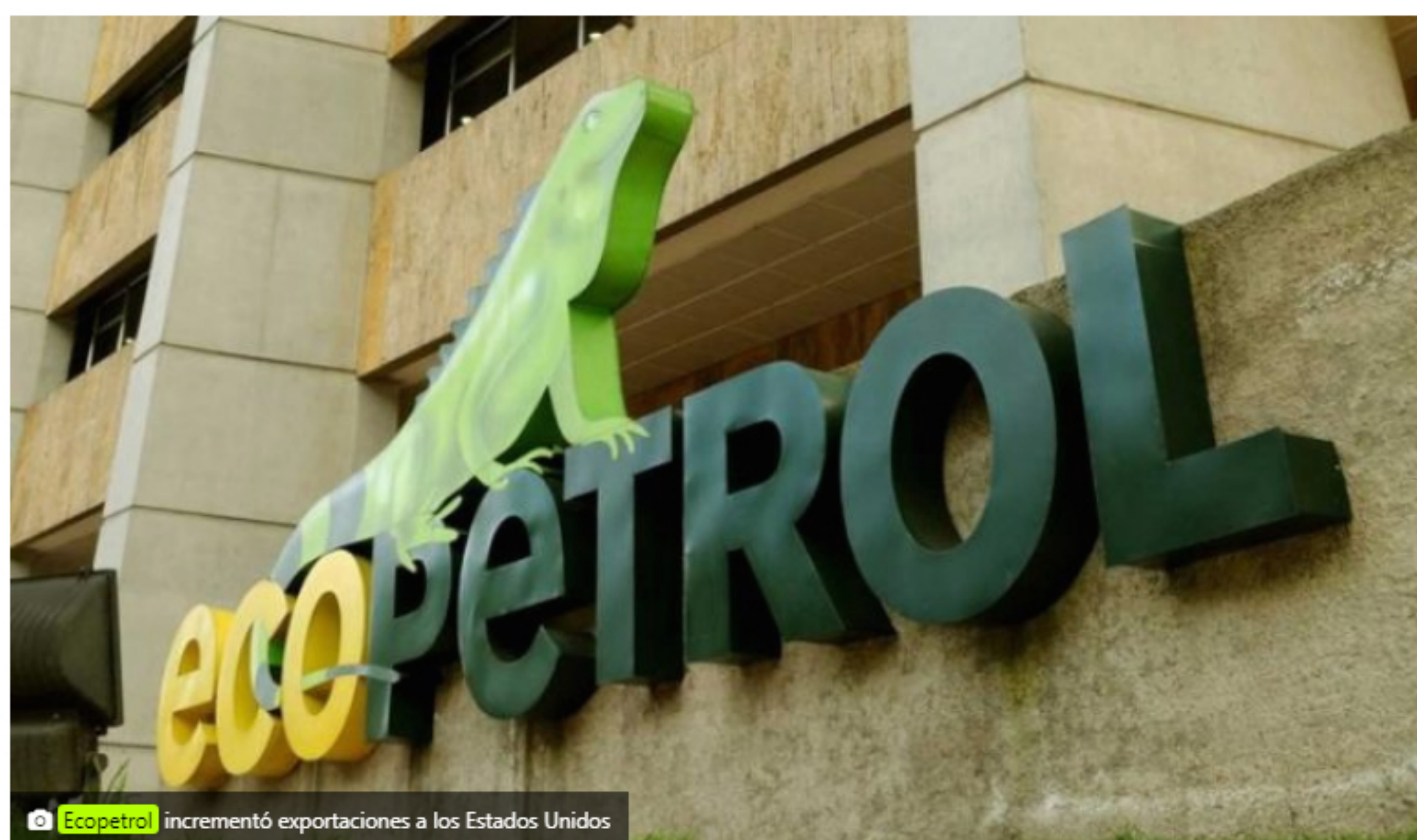
Ecopetrol incrementó exportaciones a los Estados Unidos

Luego de dos meses de suspensión temporal debido a las medidas preventivas adoptadas para evitar la propagación de la covid-19, Ecopetrol inició los trámites con la Alcaldía de Aguazul (Casanare) para reanudar la perforación del pozo Liria YW12, ubicado en esta localidad.