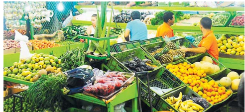
Compradores en Granabastos en Soledad.

La variación del IPC en Barranquilla fue de -0,07%.