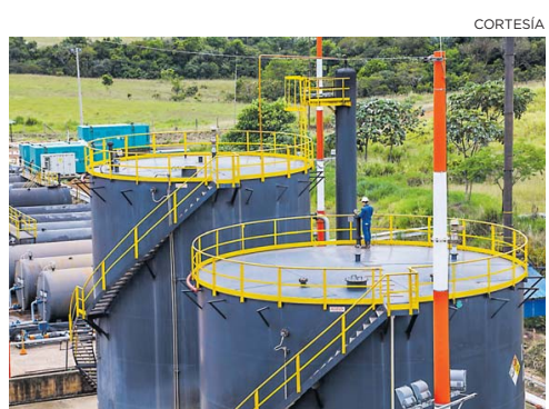
Trabajador de Ecopetrol en una planta.

De igual manera viene reforzando y exigiendo a sus trabajadores y a las empresas aliadas el cumplimiento riguroso de los protocolos de prevención y de las medidas de autocuidado, tanto en las zonas de operación como en el trabajo remoto en casa, para contener la expansión del coronavirus.