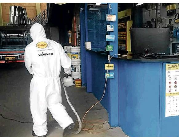
Operarios de Pintuco durante la desinfección de las 3.000 ferreterías beneficiadas del programa que busca ayudarles en la reapertura.

Las ayudas de las empresas son clave en este momento que afronta el país ya que en muchos lugares apoyan al sistema de salud. Además, según Raúl Ávila, experto en empresas, “hoy en día los consumidores promedio están bombardeados de forma