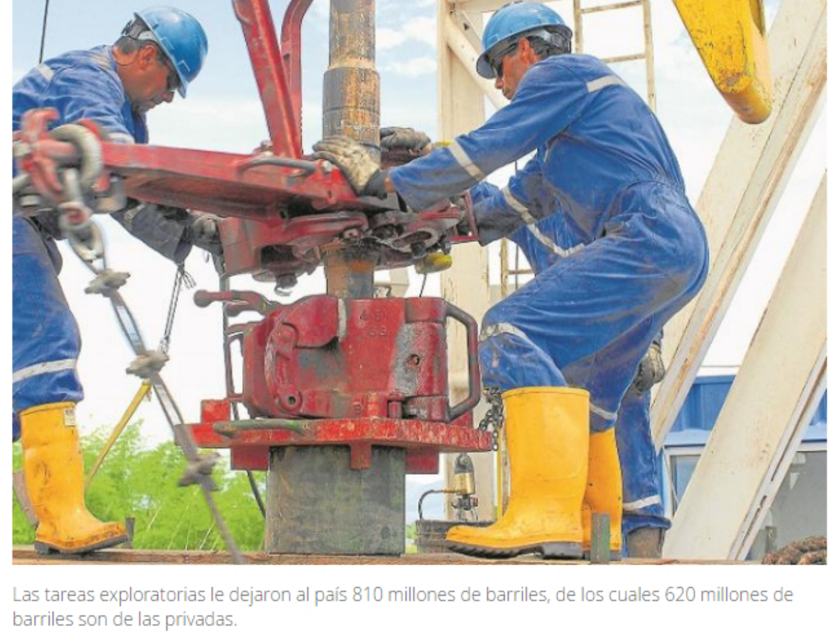
Las tareas exploratorias le dejaron al país 810 millones de barriles, de los cuales 620 millones de barriles son de las privadas.