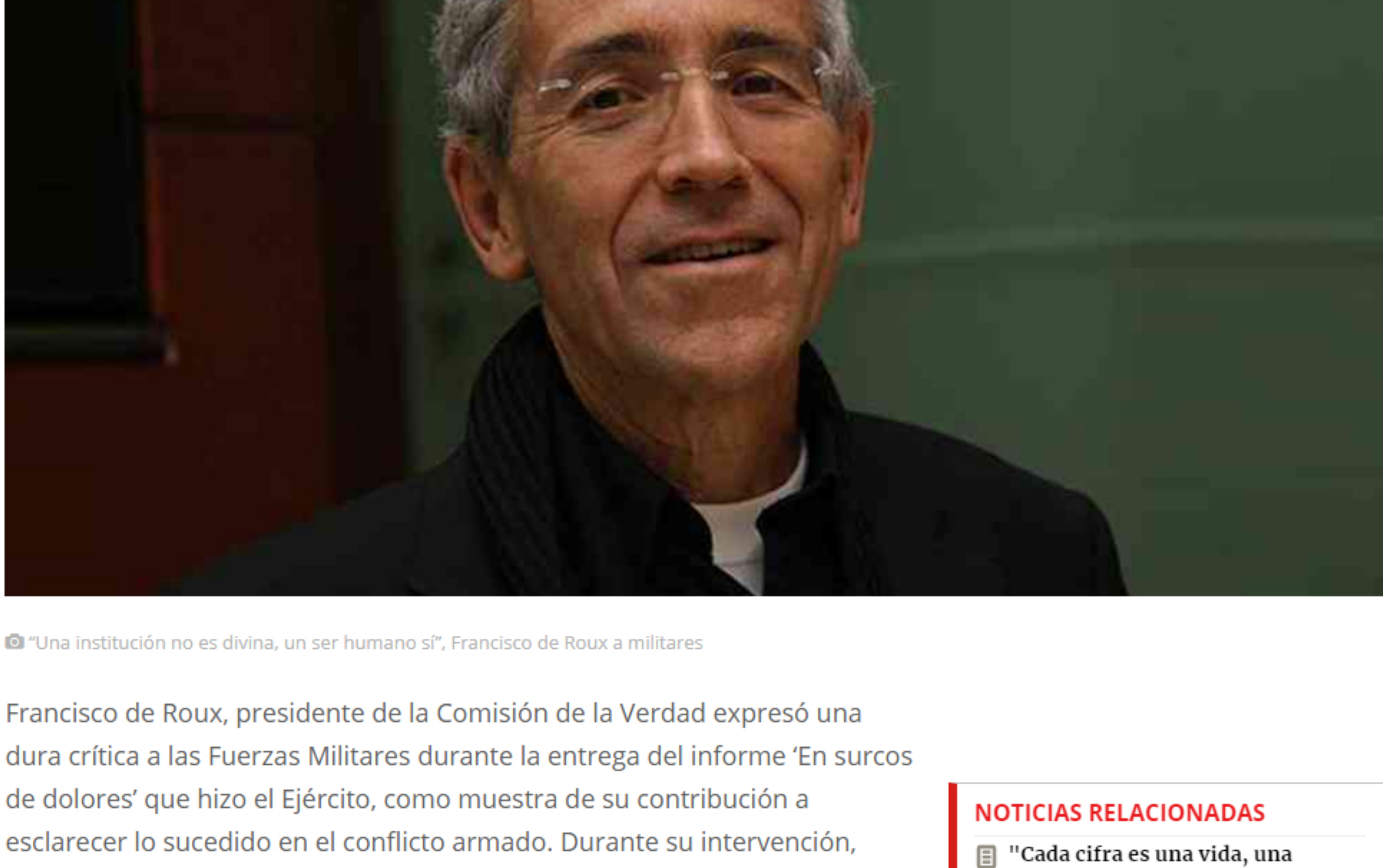
“Una institución no es divina, un ser humano sí”, Francisco de Roux a militares

El padre que dirige la Comisión de la Verdad pidió a las Fuerzas Militares no negar sus faltas, como lo han hecho los integrantes de las Farc al decir que no vincularon niños a la guerra.