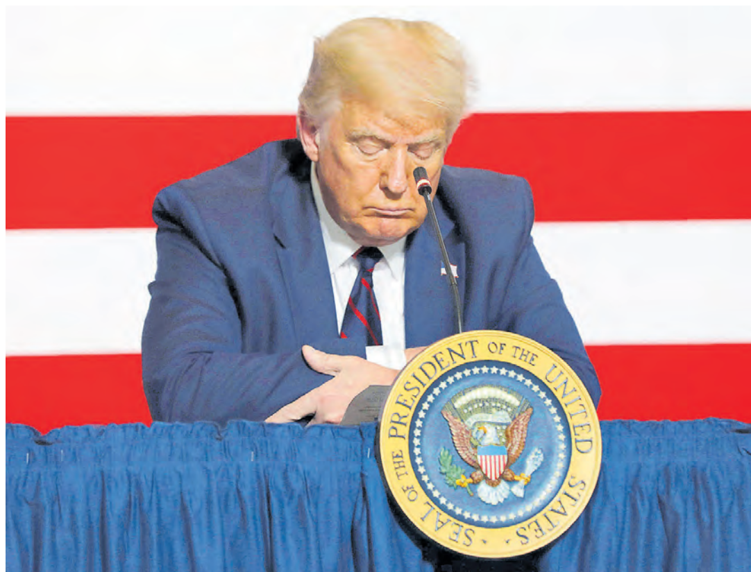
Donald Trump insiste en su propuesta de aplazar las elecciones presidenciales de noviembre próximo.

Su economía retrocedió 32,9% anualizado y 9,5% frente al periodo anterior en el segundo trimestre, lo que sumado al 5% hasta marzo se traduce en una pérdida de US$2,3 billones. Al mismo tiempo, Donald Trump sugirió posponer las elecciones de noviembre para evitar fraudes. Pág. 14