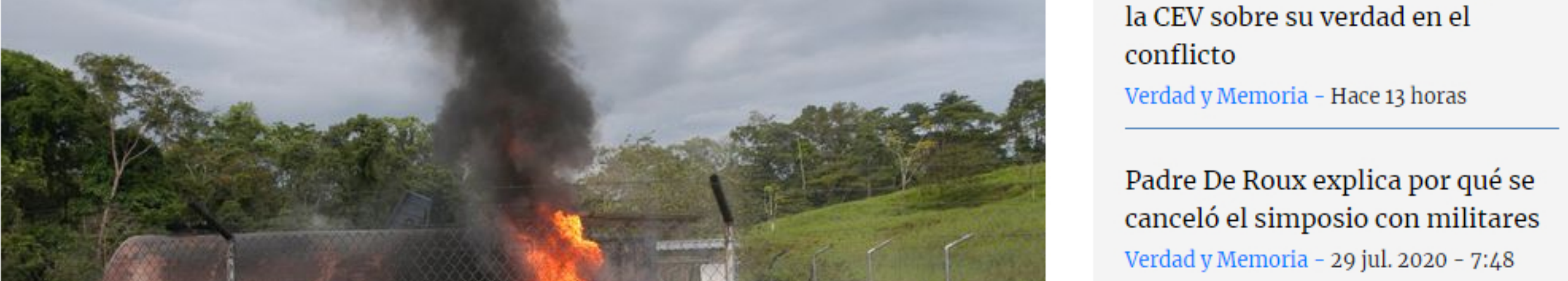
El informe recoge los daños físicos, ambientales y psicológicos que han sufrido las comunidades aledañas y empleados del sector petrolero.

Estas acciones armadas, cometidas principalmente por las Farc y el Eln entre 1986 y 2016, dejaron más de 4.400 afectaciones, como daños a la infraestructura, al medio ambiente y a comunidades circundantes. La información fue entregada a la Comisión de la Verdad.