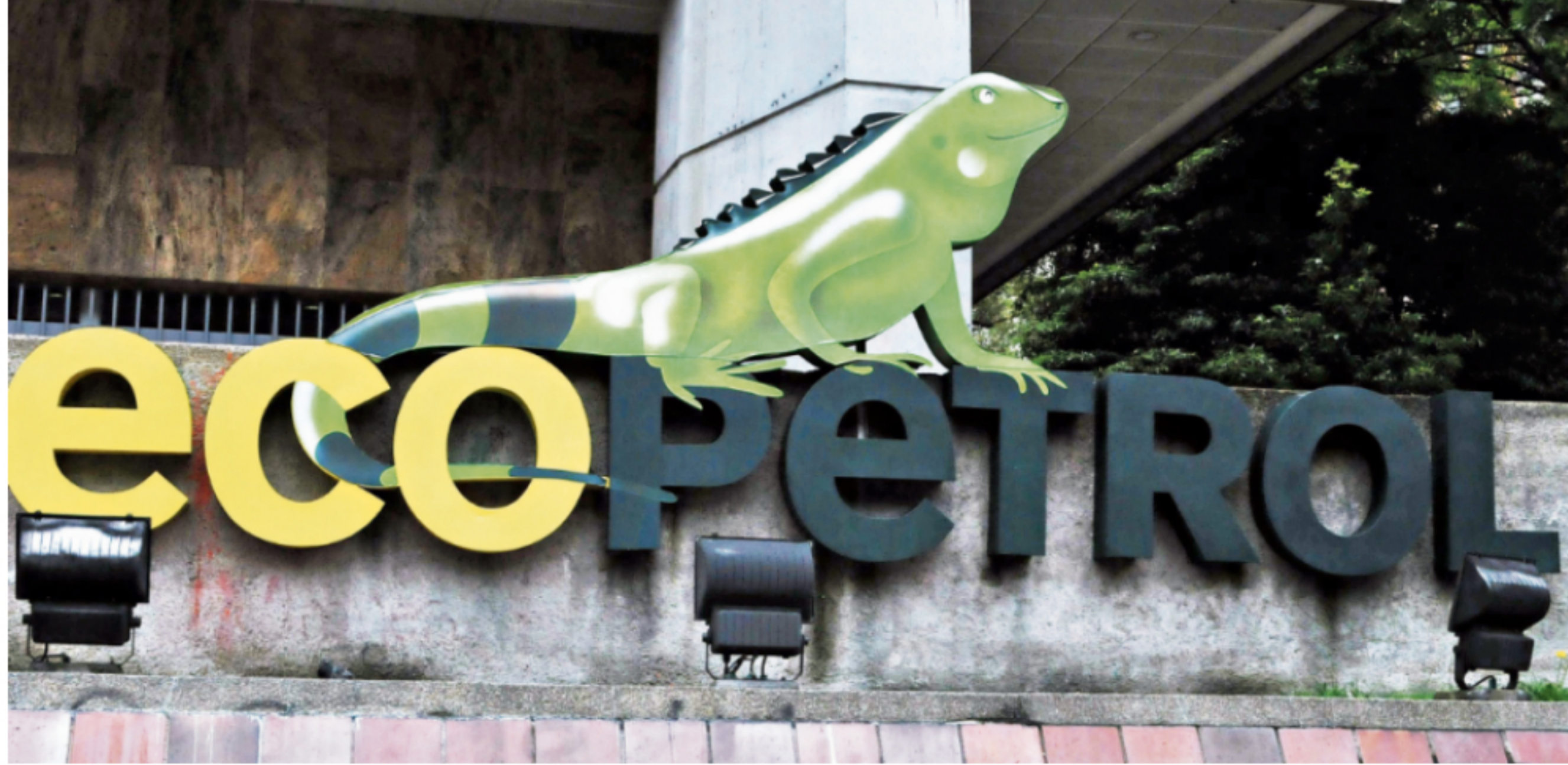
Las ventas totales de Ecopetrol , sin contar las otras empresas del grupo empresarial, representaron el 9,1 por ciento de los ingresos de las 1.000 empresas más grandes del país en 2019.