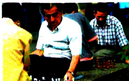
El decreto que hundió la Corte abrió la puerta para el paso de pensionados de fondos privados a Colpensiones

En ese sentido, al permitir ese traslado, los fondos privados debían entregar a Colpensiones el valor del saldo de la cuenta de ahorro individual y los rendimientos del afiliado, más el bono pensional, es decir, los ahorros que tenía aquella persona