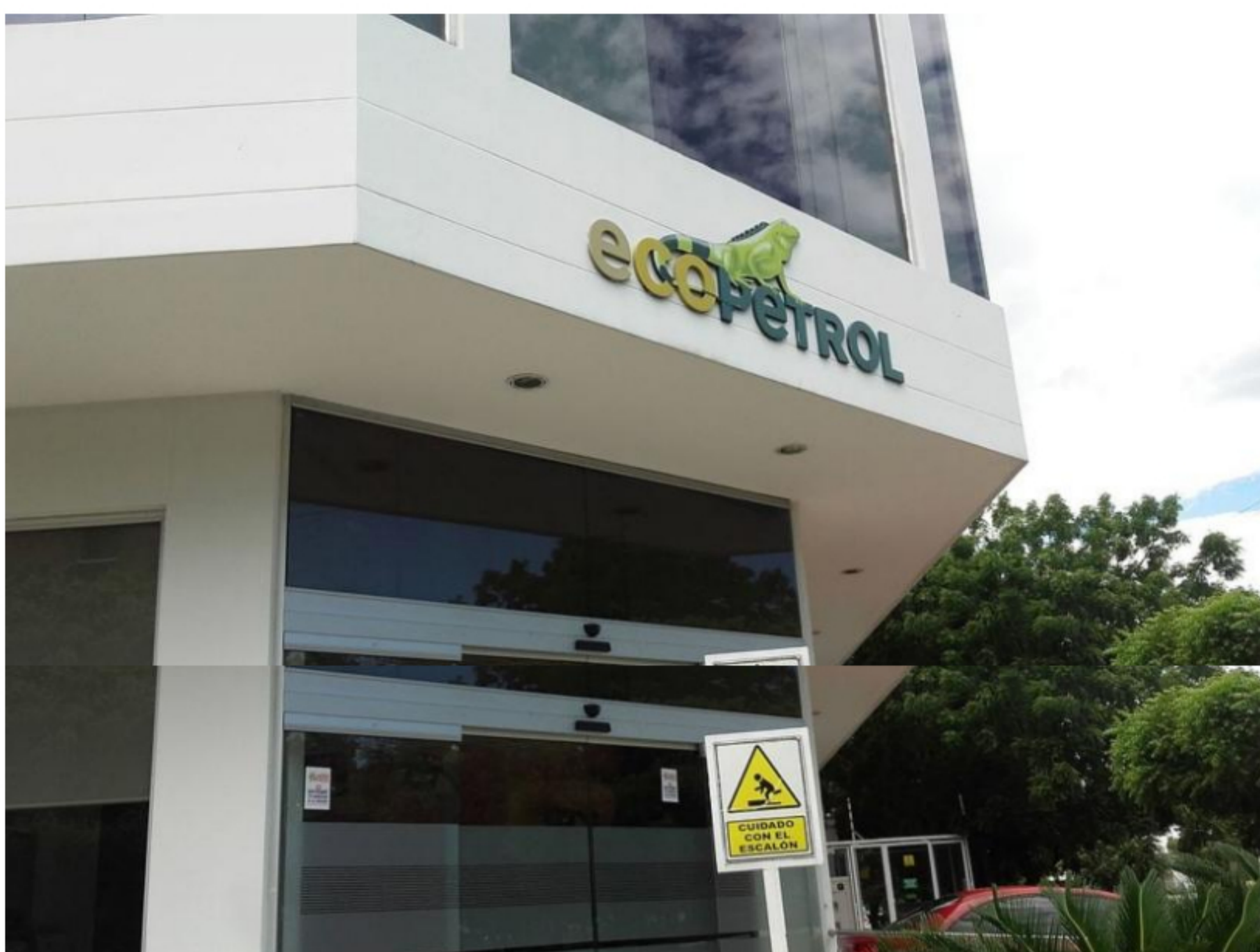
País: Colombia. La única colombiana en el listado y también la sociedad estatal más grande de la región. Ventas estimadas en US$19.400 millones, ganancias de US$2.800 millones, activos por US$42.500 millones y valor de mercado de US$45.700 millones. Wikimedia Commons

El presidente de la Central Unitaria de trabajadores (CUT), Diogenes Orjuela, rechazó las intenciones que tendría el Gobierno Nacional de vender las acciones de algunas empresas del Estado, como Ecopetrol, entras entidades a nivel nacional.