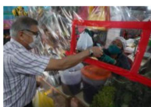
PIB de Colombia caerá 5,6 % por el impacto del coronavirus