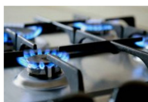
¡Tenlo en cuenta! El pago de los servicios públicos se reactiva en agosto