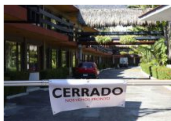
Fenalco presenta plan para salvar a las empresas