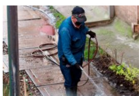
Si trabaja en labores domésticas podrá acceder gratis al sistema bancario