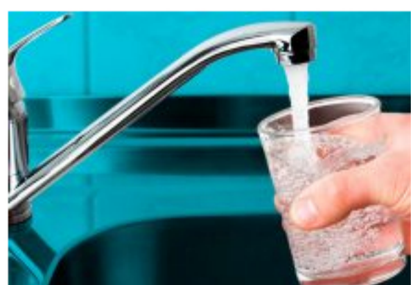
Corte tumbó decreto para alivio de servicios públicos