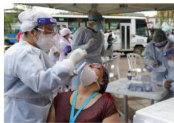
Conozca las ocupaciones con más contagios de coronavirus en Colombia