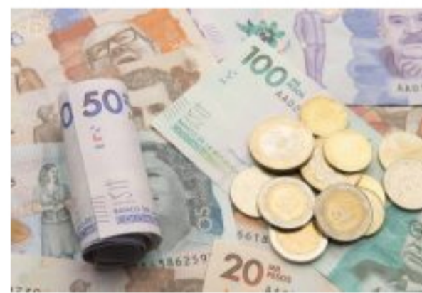
Aprobaron 294.848 subsidios de emergencia al cesante de más de 700 mil solicitudes