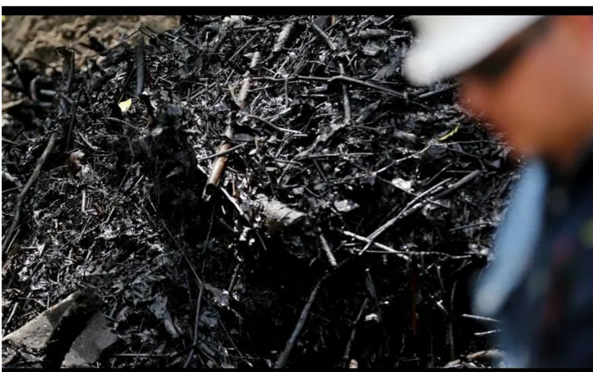
Ecopetrol denunció que hasta el 5 de mayo hubo 25 atentados, en especial contra los oleoductos Caño Limón-Coveñas y Bicentenario.

Desconocidos atacaron este viernes con explosivos una plataforma petrolera ubicada en una zona rural del departamento de Arauca, fronterizo con Venezuela , informó la petrolera estatal Ecopetrol .