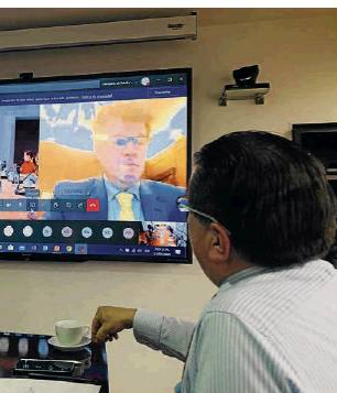
Ministerio de Salud

Fernando Ruíz, ministro de Salud, aseguró que la situación de la capital se seguirá monitoreando.