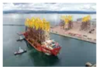
Foto: 'Hawk' trae diez chaquetas del parque eólico marino de Moray East

VAALCO Energy extiende carta para FPSO Petróleo Nautipa