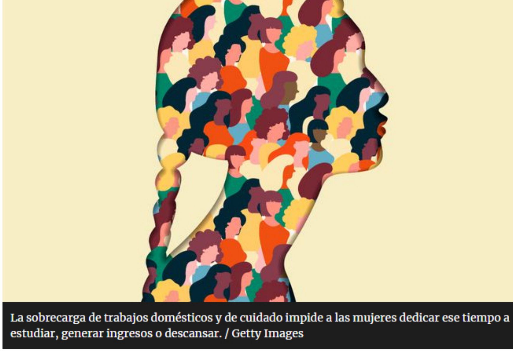
La sobrecarga de trabajos domésticos y de cuidado impide a las mujeres dedicar ese tiempo a estudiar, generar ingresos o descansar.

El trabajo del hogar es fundamental para la vida y su reproducción. Sin alimentos, ropa limpia o cuidados para los niños y niñas o cuando estamos enfermos o con alguna discapacidad sería imposible nuestra supervivencia. Pese a lo vitales que son, este tipo de labores han sido históricamente subvaloradas y han recaído desproporionalmente sobre las mujeres, a causa de ideas equivocadas alrededor del género, como que ellas son “mejores” para ese tipo de tareas.