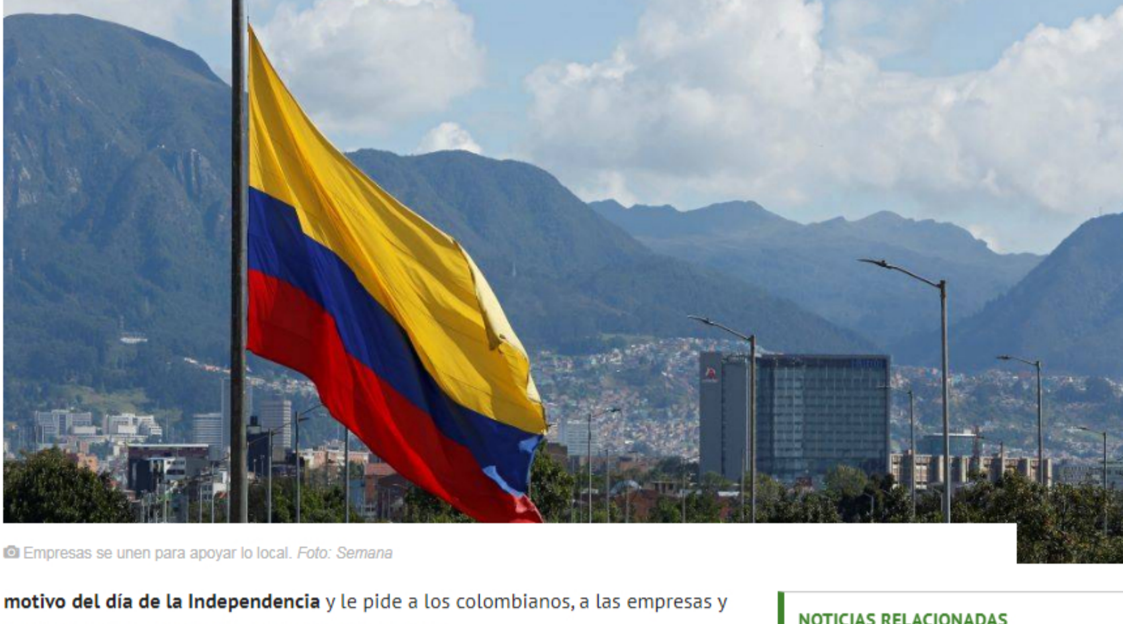
Empresas se unen para apoyar lo local.

Un grupo de 115 empresas y marcas colombianas se unieron para darle vida a la campaña "Hagamos lo que diga el corazón: apoyemos lo nuestro" que invita a las empresas y colombianos a apoyar lo local y superar el momento que vive el país.