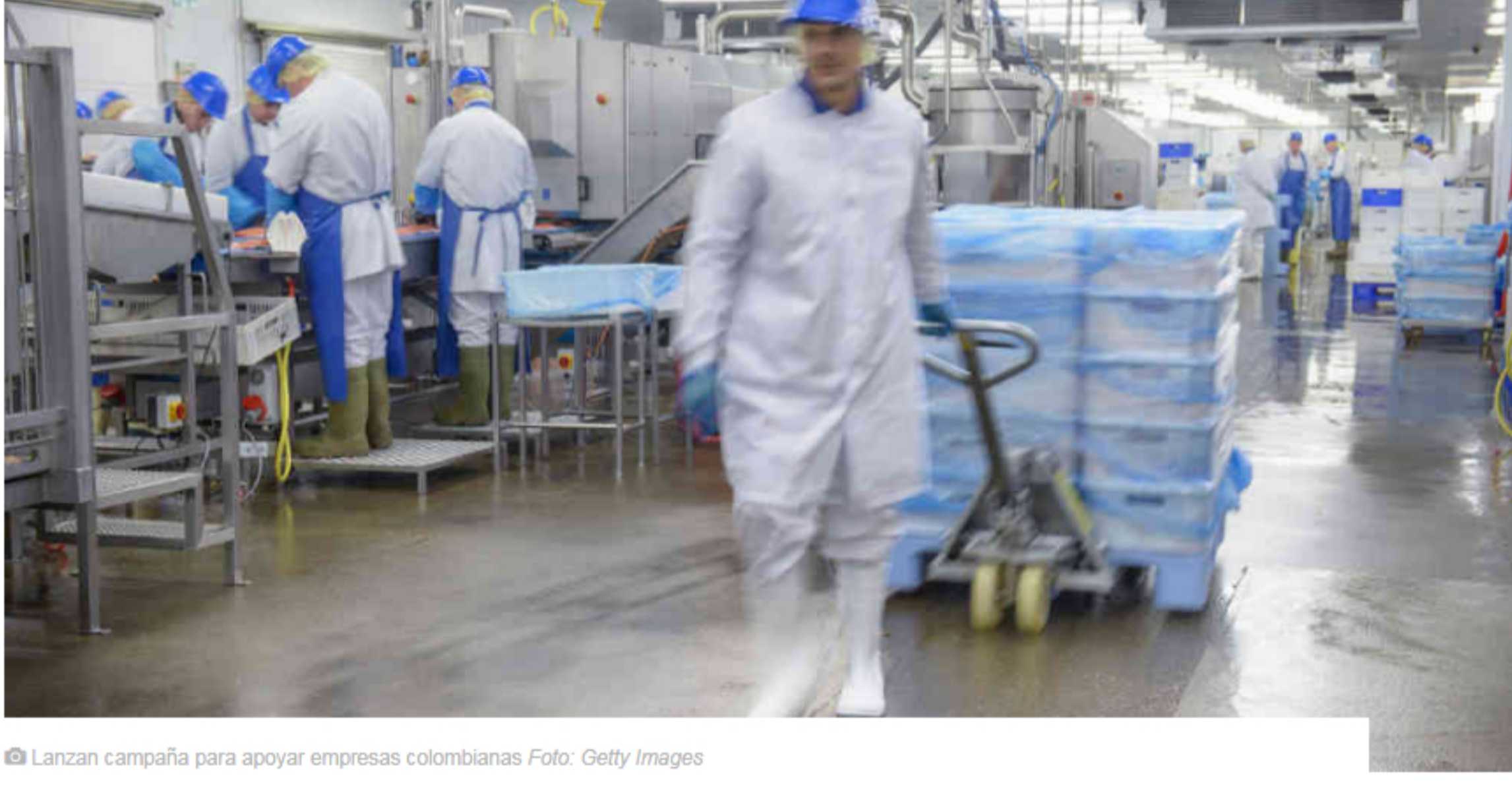
Lanzan campaña para apoyar empresas colombianas

Por primera vez en la historia del país, 115 compañías de distintos sectores decidieron sumar esfuerzos alrededor del movimiento "Hagamos lo que diga el corazón: apoyemos lo nuestro", para recuperar la esperanza en el futuro del país.