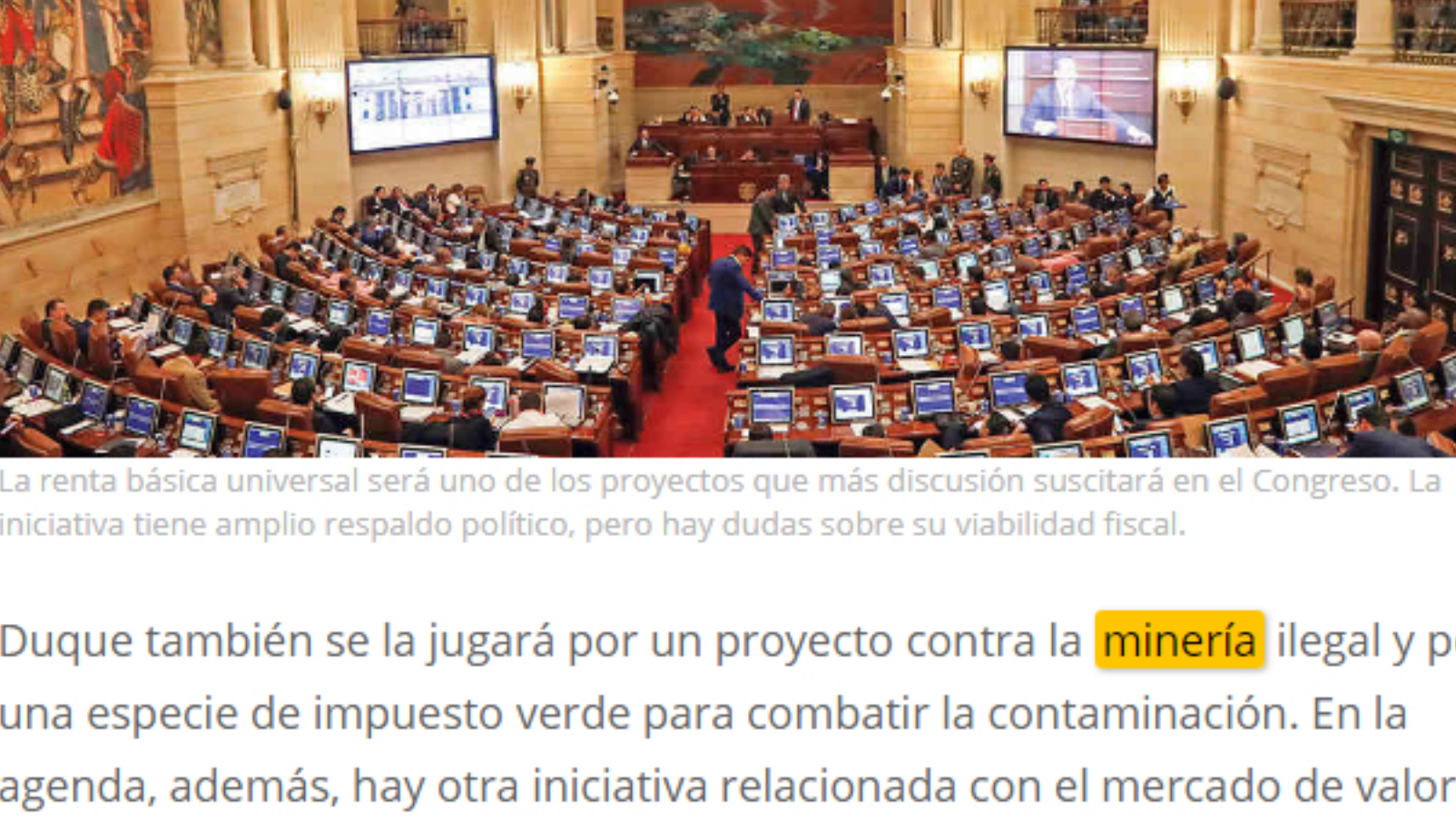
La renta básica universal será uno de los proyectos que más discusión suscitará en el Congreso. La iniciativa tiene amplio respaldo político, pero hay dudas sobre su viabilidad fiscal.

Este proyecto, por falta de debate, naufragó en la legislatura pasada y ahora será radicado con una novedad. Además de los tres meses de salario mínimo, plantea transferir medio salario mínimo por dos meses adicionales .