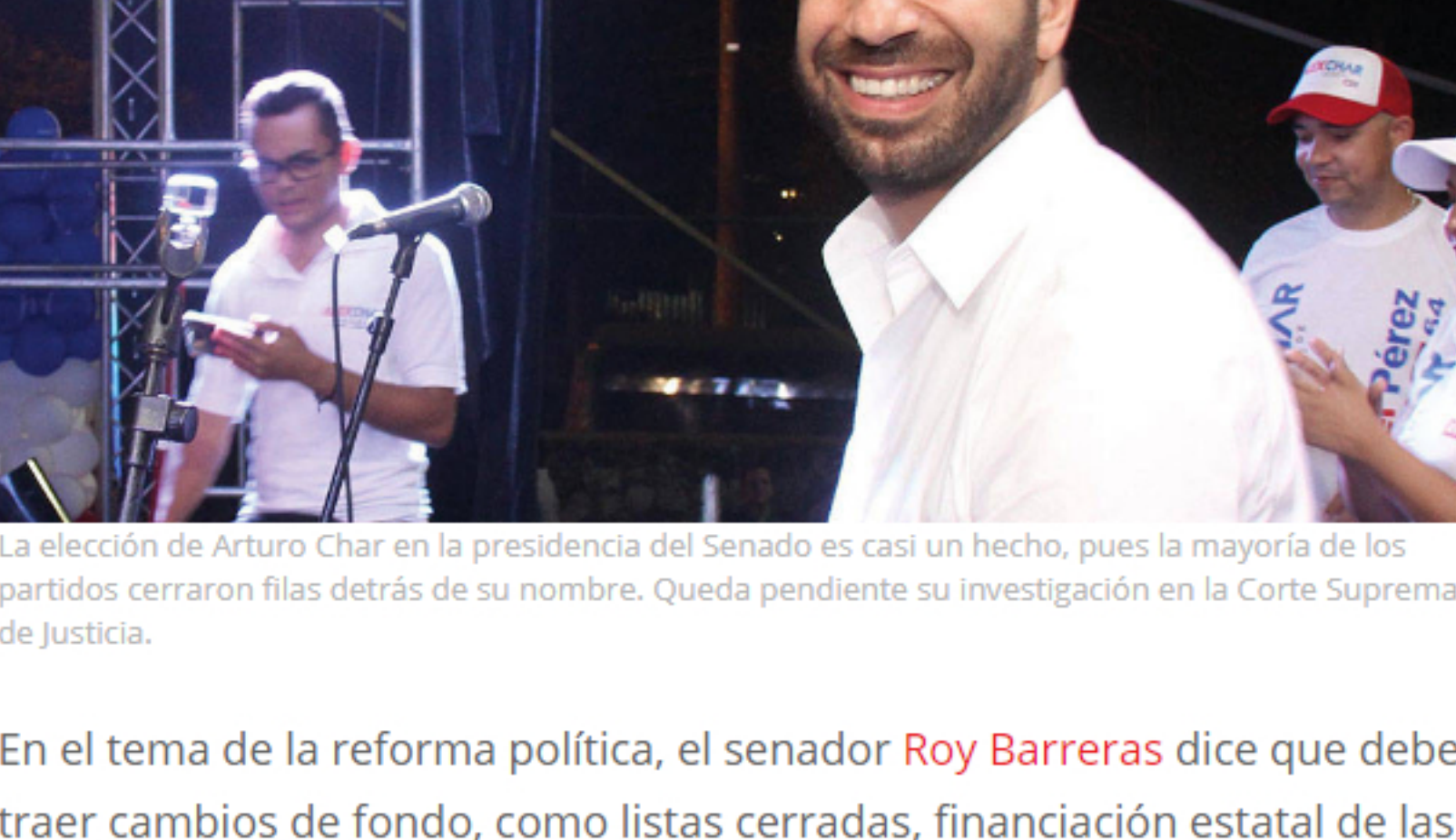
La elección de Arturo Char en la presidencia del Senado es casi un hecho, pues la mayoría de los partidos cerraron filas detrás de su nombre. Queda pendiente su investigación en la Corte Suprema de Justicia.

Si todo sale como está previsto, la presidencia del Senado quedará en manos de Arturo Char (Cambio Radical) y la de la Cámara en las del conservador Germán Blanco. Ambos deberán organizar las comisiones y plenarios y recoger las experiencias, buenas y malas, vividas en la legislatura pasada, cuando trabajaron mayoritariamente en plataformas virtuales.