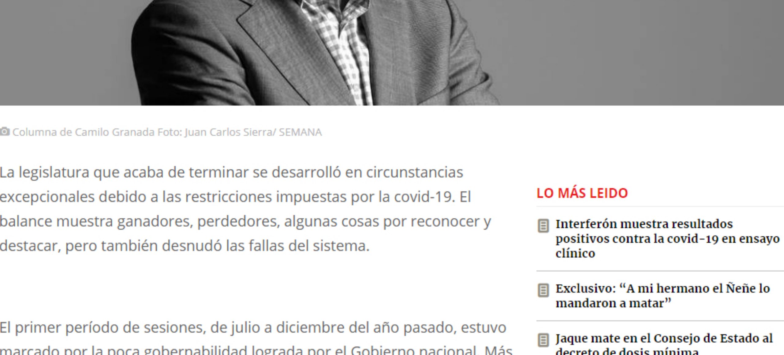
Columa de Camilo Granada

El congreso logró pasar el año raspando. Nos quedó debiendo un mayor liderazgo e iniciativas para proponer las reformas necesarias para enfrentar la recesión y el desempleo que se nos vinieron encima.