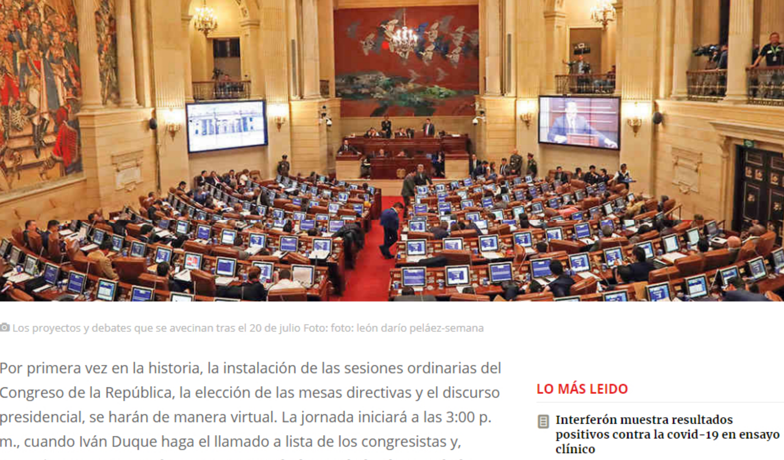
Los proyectos y debates que se avecinan tras el 20 de julio

Reformas a la justicia, a la política y al Código Electoral marcarán la agenda del segundo semestre. El Gobierno buscará que la coalición dé resultados y la oposición exigirá sesiones presenciales para los debates de control político.