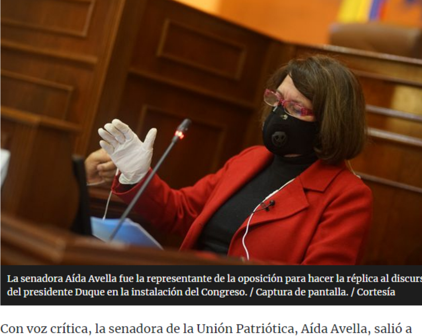
La senadora Aída Avella fue la representante de la oposición para hacer la réplica al discurso del presidente Duque en la instalación del Congreso.

Con voz crítica, la senadora de la Unión Patriótica, Aída Avella, salió a defender las premisas de la oposición con relación al discurso del Gobierno en voz del presidente Iván Duque, quien, según la congresista, no estuvo presente en la plataforma Zoom para escuchar la réplica de la oposición. La ministra del Interior, Alicia Arango, compartió al tiempo de la constancia una foto del primer mandatario escuchando a Avella.