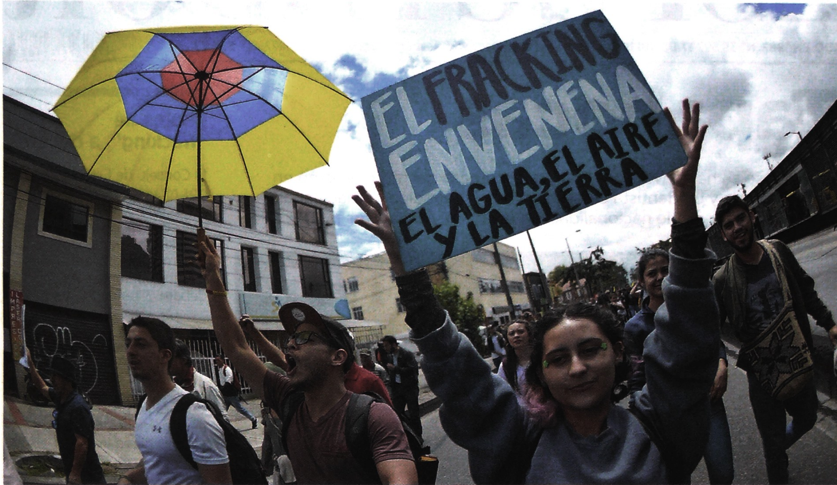
Luego del Decreto 328 de 2020, el Gobierno debe expedir más reglamentaciones sobre los pilotos de investigación en "fracking". / Diego Cuevas