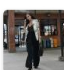
Corte citó a hija de Aida Merlano para que declare en el caso de Arturo Char

Eventual presidencia del Senado de Arturo Char divide opiniones entre bancadas