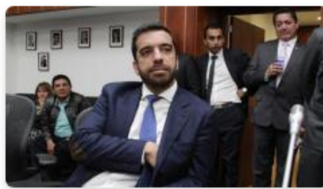
Cambio Radical ratifica apoyo a Arturo Char a la Presidencia del Congreso