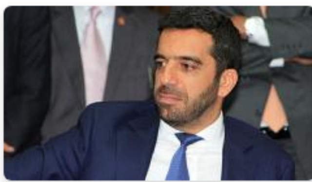
Mayorías respaldan postulación de Char como presidente del Senado