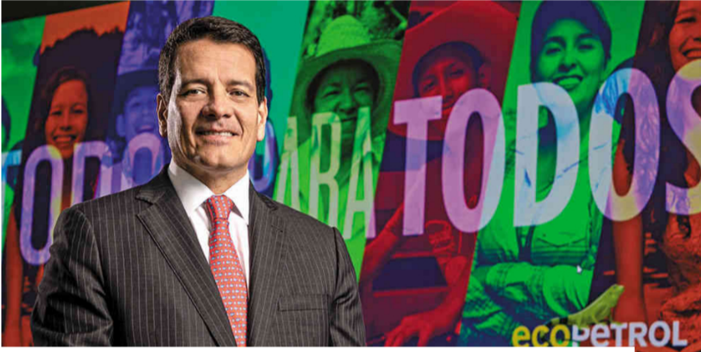
📍 Felipe Bayón, presidente de Ecopetrol

Ecopetrol anunció un nuevo ajuste en su plan de inversiones de 2020 entre US$3.000 y US$3.400 millones, un aumento frente al plan de inversiones de mayo. La petrolera mantendrá una producción de 700.000 barriles de hidrocarburos por día y espera un promedio Brent de US$38.