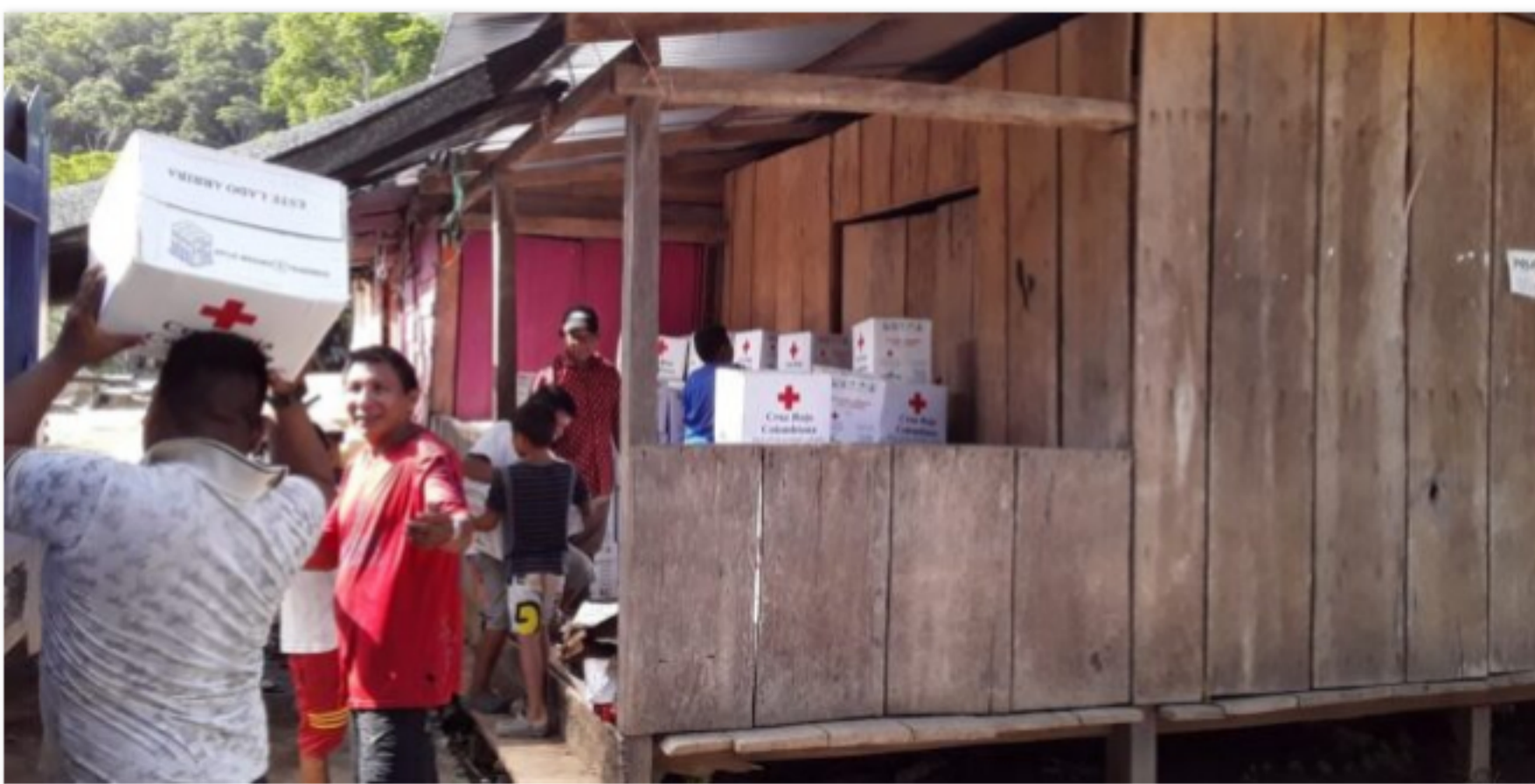
Ecopetrol entrega los kits a los alcaldes por medio de la Cruz Roja Colombiana, para que sean distribuidos a las comunidades respectivas.

Inicio / Destacado Barra / AYUDA HUMANITARIA. Comunidades indígenas recibieron 1970 mercados