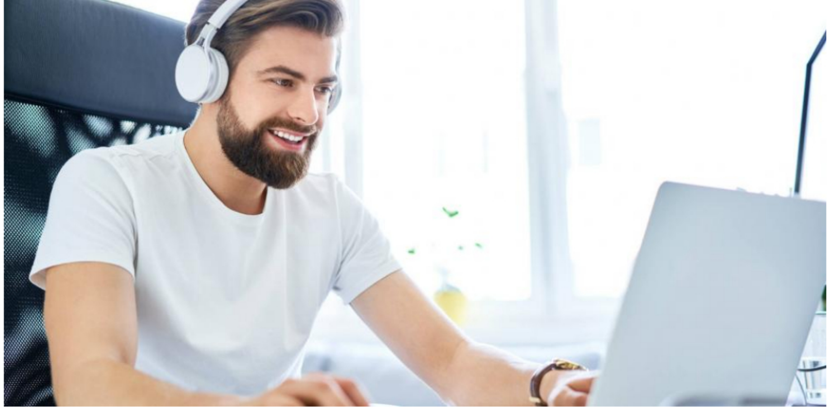
Con esta iniciativa, para 2025 se proyecta entre 68.000 y 112.000 desarrolladores de software.

RELACIONADOS: TECNOLOGÍA | MINTIC | CONVOCATORIAS | PROGRAMACIÓN | TECNOLOGÍA E INNOVACIÓN