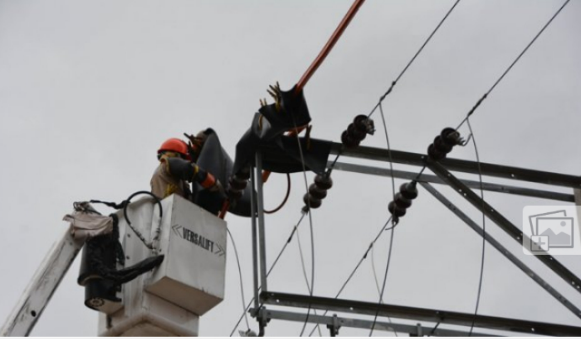
Los desembolsos de dinero se harán por la filial Ecopetrol Energía en dos fases.

La iniciativa beneficia a alrededor de 30.000 familias de estratos 1 y 2, afectadas por la pandemia.