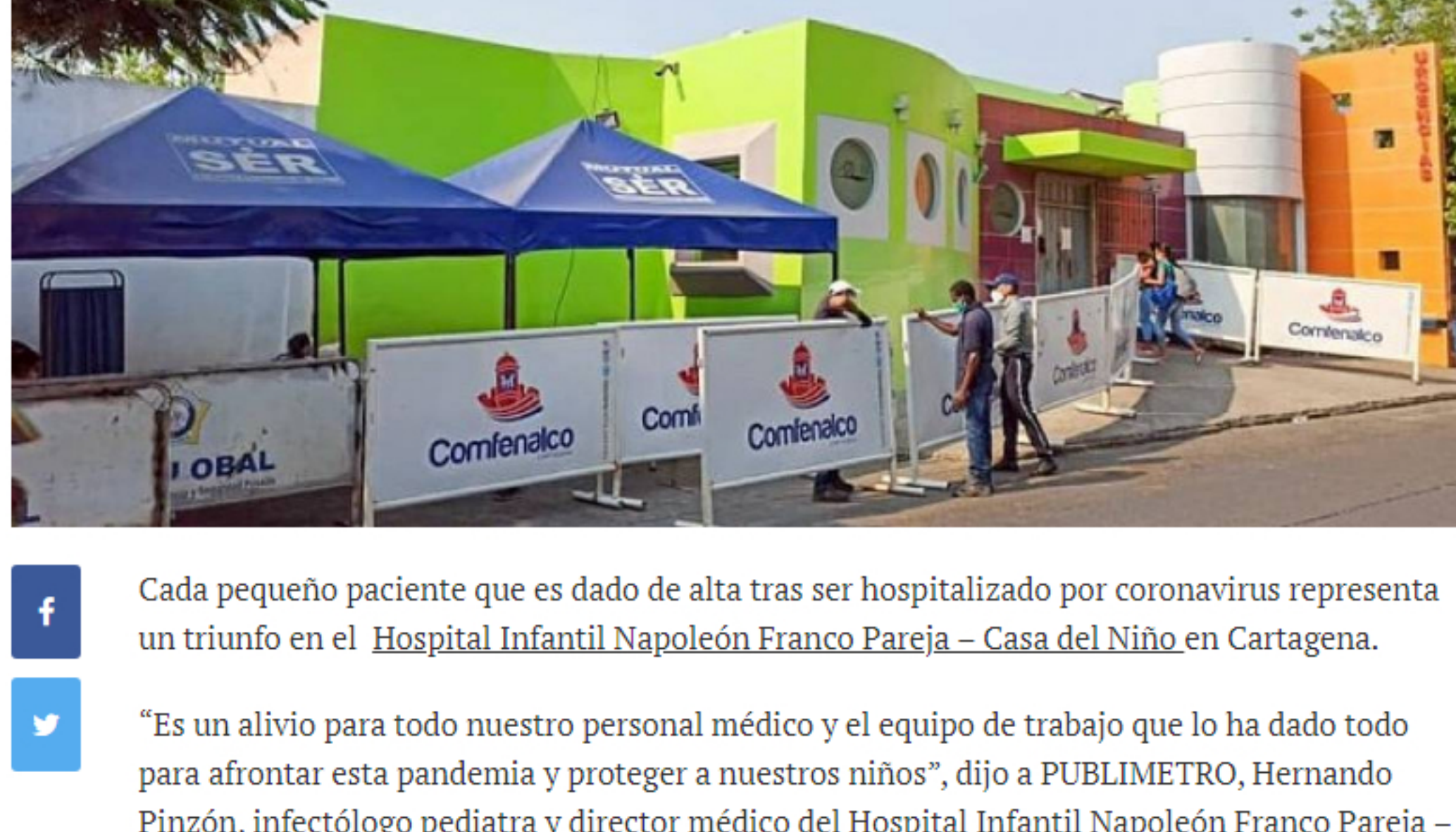
Fachada del Hospital Infantil Napoleón Franco Pareja - Casa del Niño en Cartagena. - Hospital Infantil Napoleón Franco Pareja - Casa del Niño en Cartagena.

Cada pequeño paciente que es dado de alta tras ser hospitalizado por coronavirus representa un triunfo en el Hospital Infantil Napoleón Franco Pareja - Casa del Niño en Cartagena.