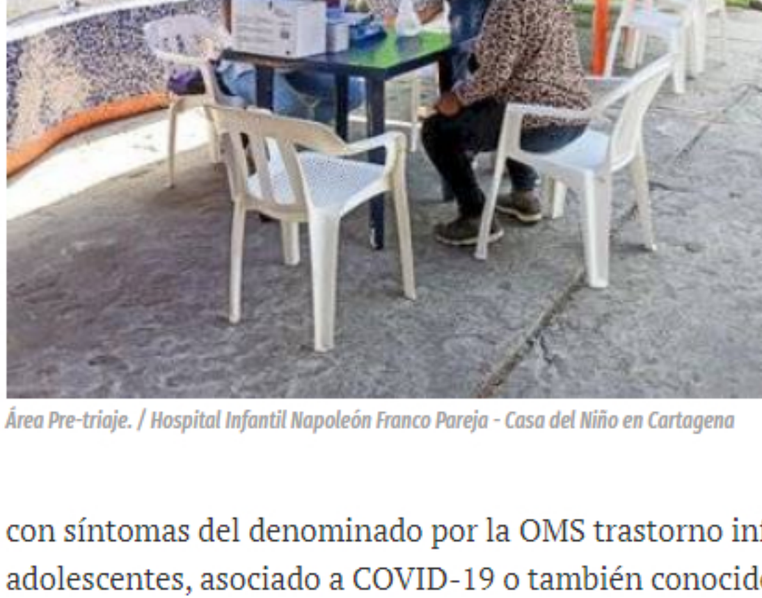
Área Pre-Triage. / Hospital Infantil Napoleón Franco Pareja - Casa del Niño en Cartagena