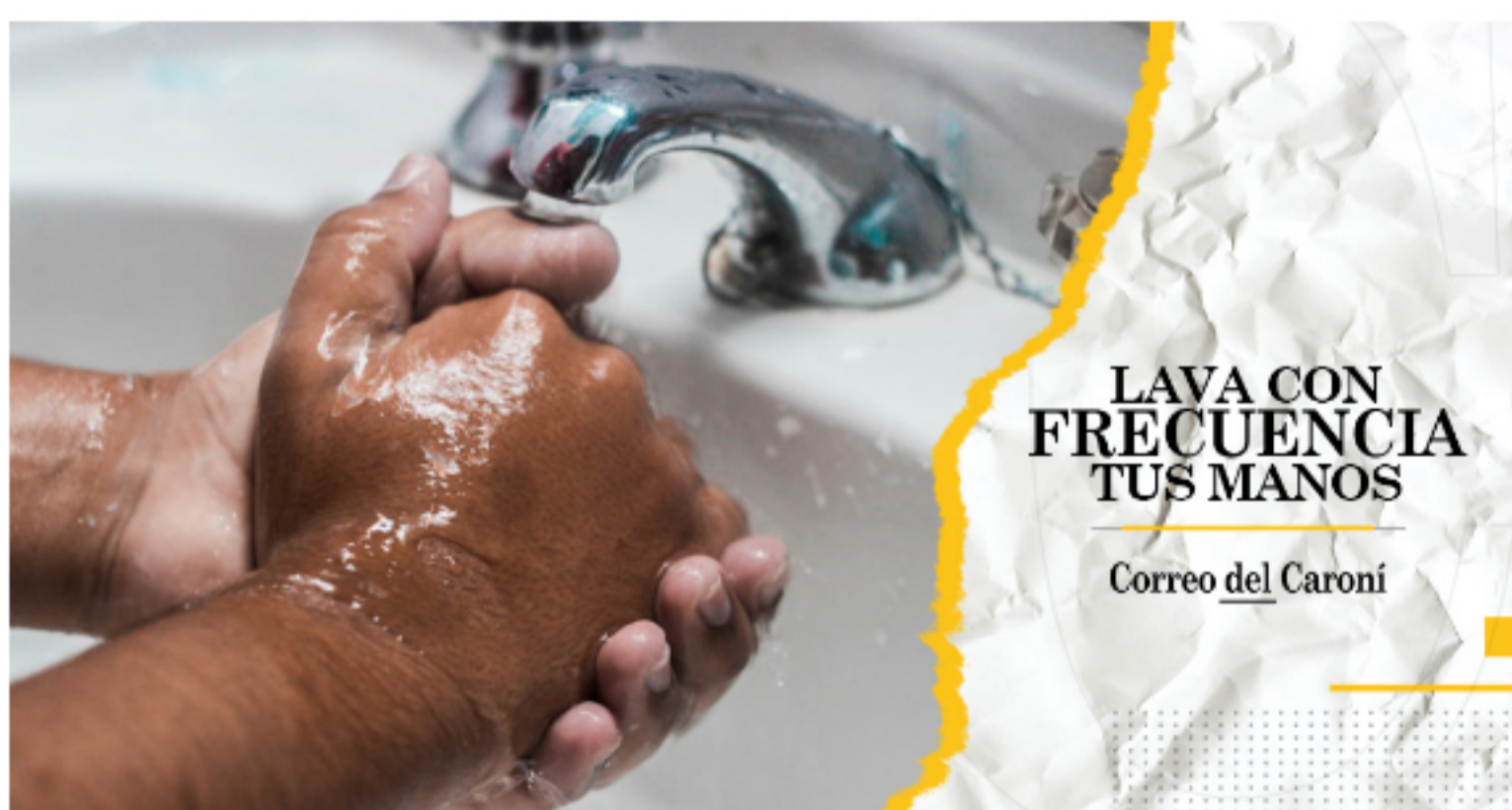
Es una verdad científica que al virus lo mata el lavado de manos con agua y jabón

3 Aplicar obligatoriamente alcohol en las manos y organizar los flujos de ingreso a las tiendas