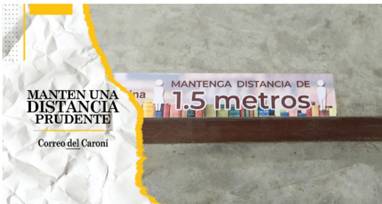
Ordenar los flujos de personas en los locales comerciales es una dimensión que no puede abandonarse