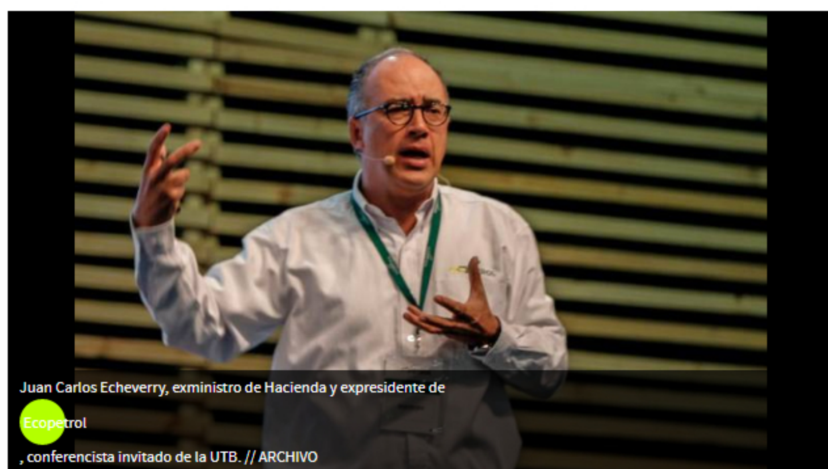
Juan Carlos Echeverry, exministro de Hacienda y expresidente de Ecopetrol, conferencista invitado de la UTB.

EL UNIVERSAL | @EiUniversalCtg | HERMES FIGUEROA ALCÁZAR | @EiUniversalCtg | 09 de julio de 2020 12:00 AM