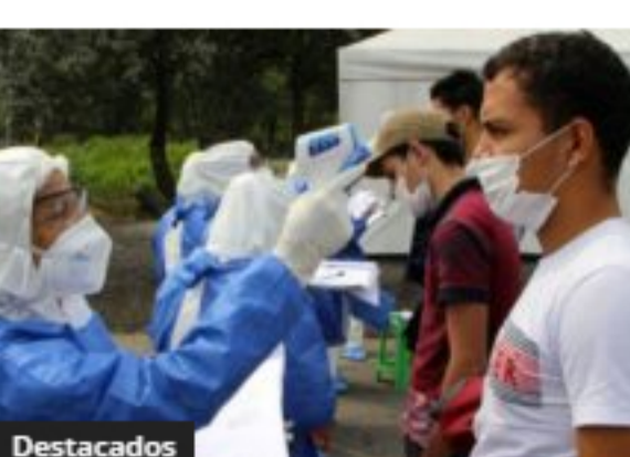
Destacados Incrementaron los casos de coronavirus en Antioquia