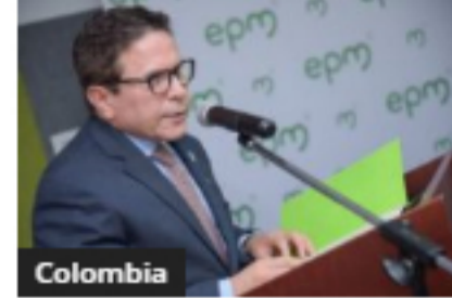
Colombia EPM adjudicó bonos en pesos y dólares