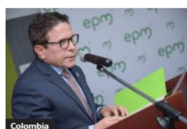
Colombia EPM adjudicó bonos en pesos y dólares