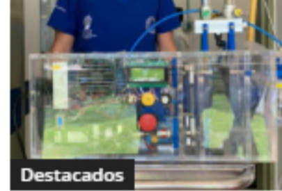
Destacados Gobierno entregó 30 ventiladores a Antioquia para fortalecer las UCI