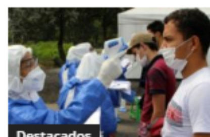
Destacados Incrementaron los casos de coronavirus en Antioquia