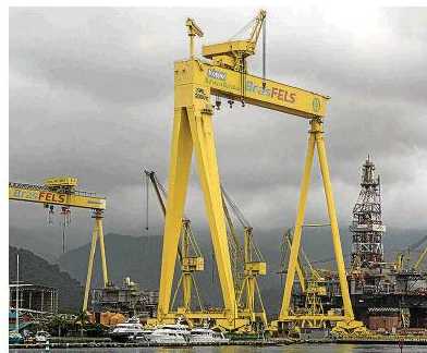
El banco de desarrollo estatal de Brasil vendió 734 millones de acciones.

Bndes , como se conoce al banco, vendió los 734 millones de acciones, incluidas las sobreescripciones, por 30 reales cada una, el miércoles por la noche, según personas familiarizadas con el asunto. La cifra