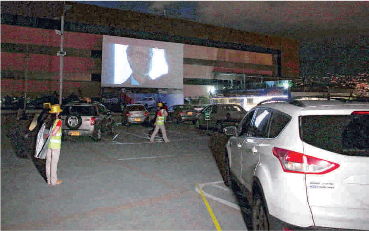
En Sabaneta, sur de Medellín, ya se pueden ver películas en autocine, mientras Bogotá espera el permiso.

La Corte avanza en el examen jurídico a las normas emitidas. De las seis de 120 declaradas inexecutable, ninguna descarrila la respuesta económica del Gobierno. Pág. 6