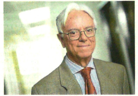
Academia Col. de Ciencias Económicas