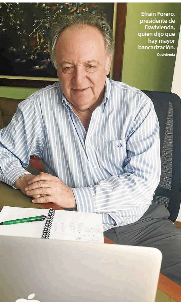
Efraín Forero, presidente de Davivienda, quien dijo que hay mayor bancarización. Davivienda