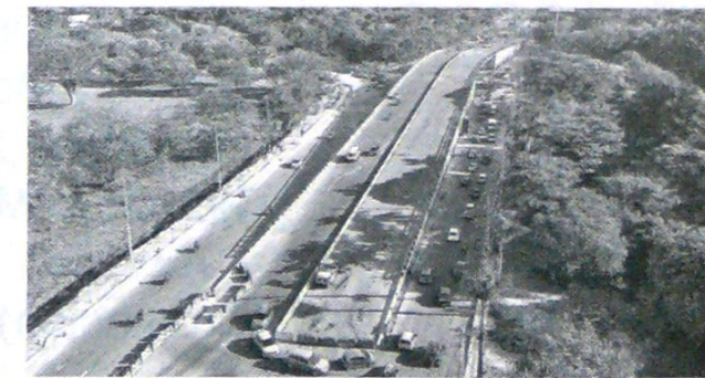
Cuidado medioambiental, tema de atención en el Valle.

Colombia está dentro de las máximas prioridades para la firma en la región".