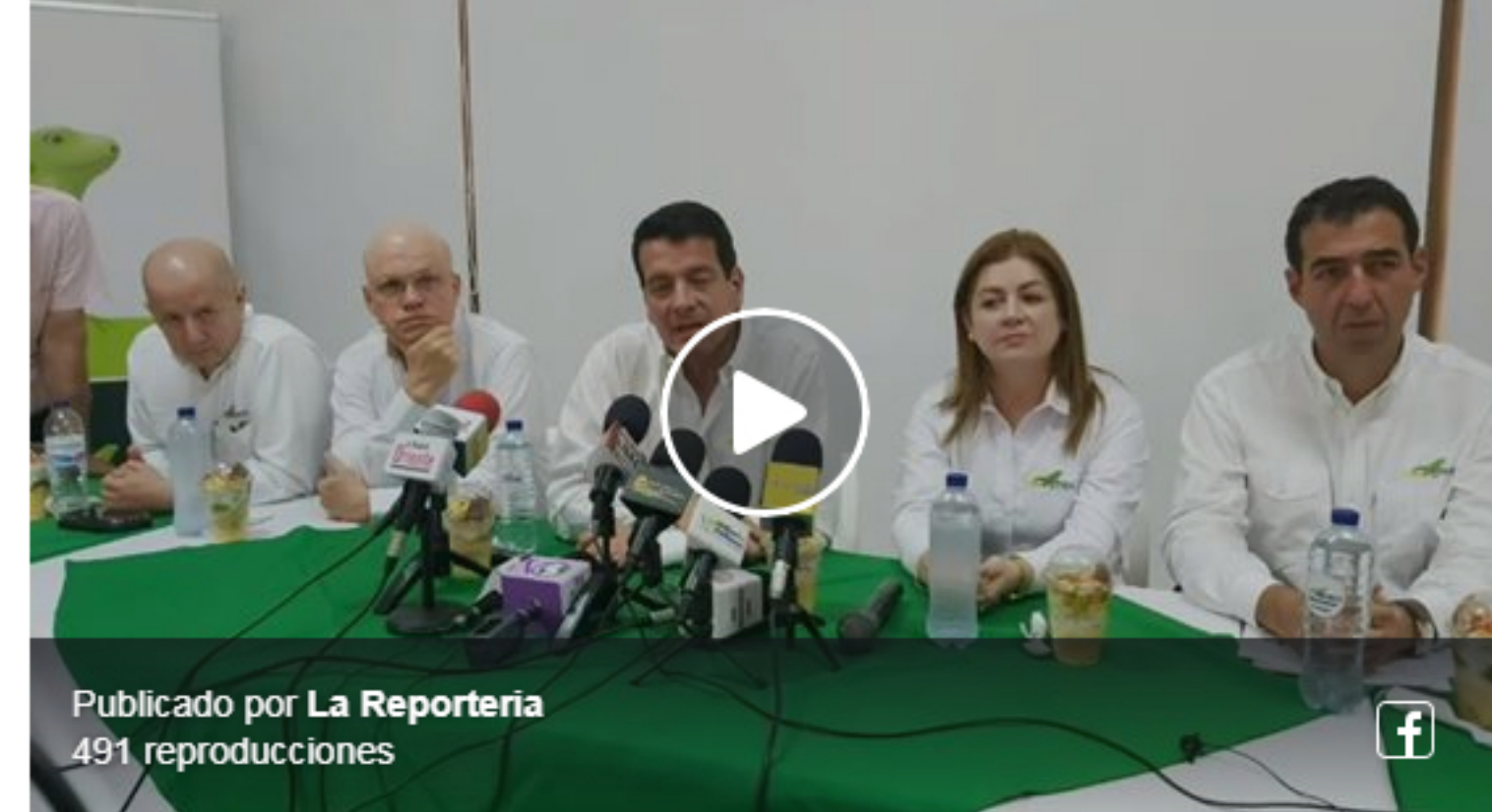
Publicado por La Reportería 491 reproducciones

“Reconocemos el buen trabajo realizado por Equión en la región durante todos estos años. Como Ecopetrol continuaremos trabajando en el fortalecimiento de la relación con las comunidades para desarrollar programas de beneficio colectivo y con responsabilidad ambiental, como lo hacemos en todas las regiones en las que operamos. Estamos aquí presentes para ratificar nuestro compromiso con esta región del país que ha marcado nuestra historia en las últimas tres décadas y que hoy en día es la principal fuente de gas para los colombianos, un combustible limpio que disfrutan cerca de 9,5 millones de familias”, expresó el presidente de Ecopetrol, Felipe Bayón.